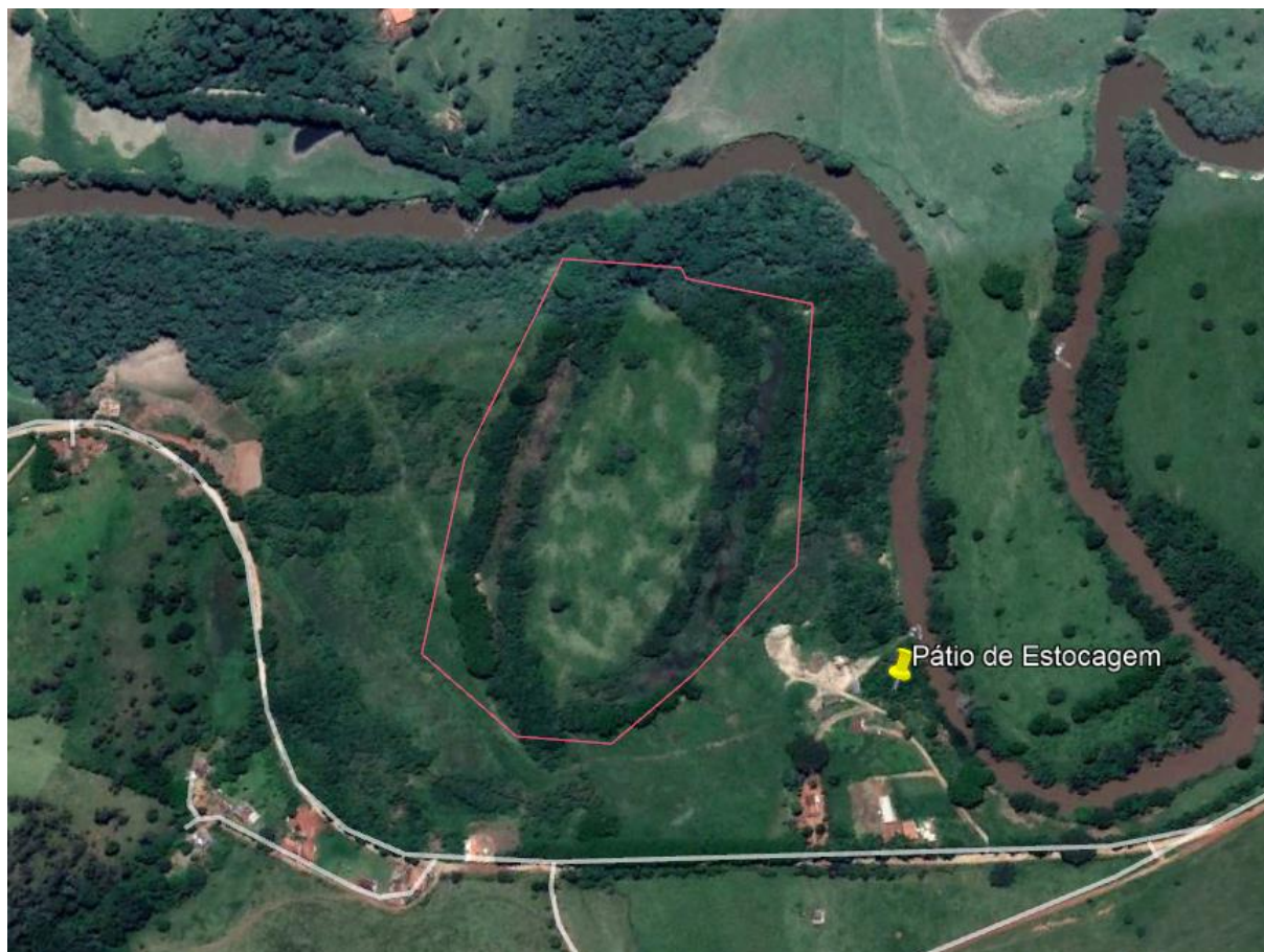
Figura 2: Área com presença de vegetação nativa, circunferência vermelha, onde foi indicado para a implantação da cava aluvionar.

Entretanto a única autorização ambiental apresenta se refere a intervenção sem supressão de vegetação nativa em uma área de 0,055 ha, não sendo portando autorizada a supressão de vegetação nativa.