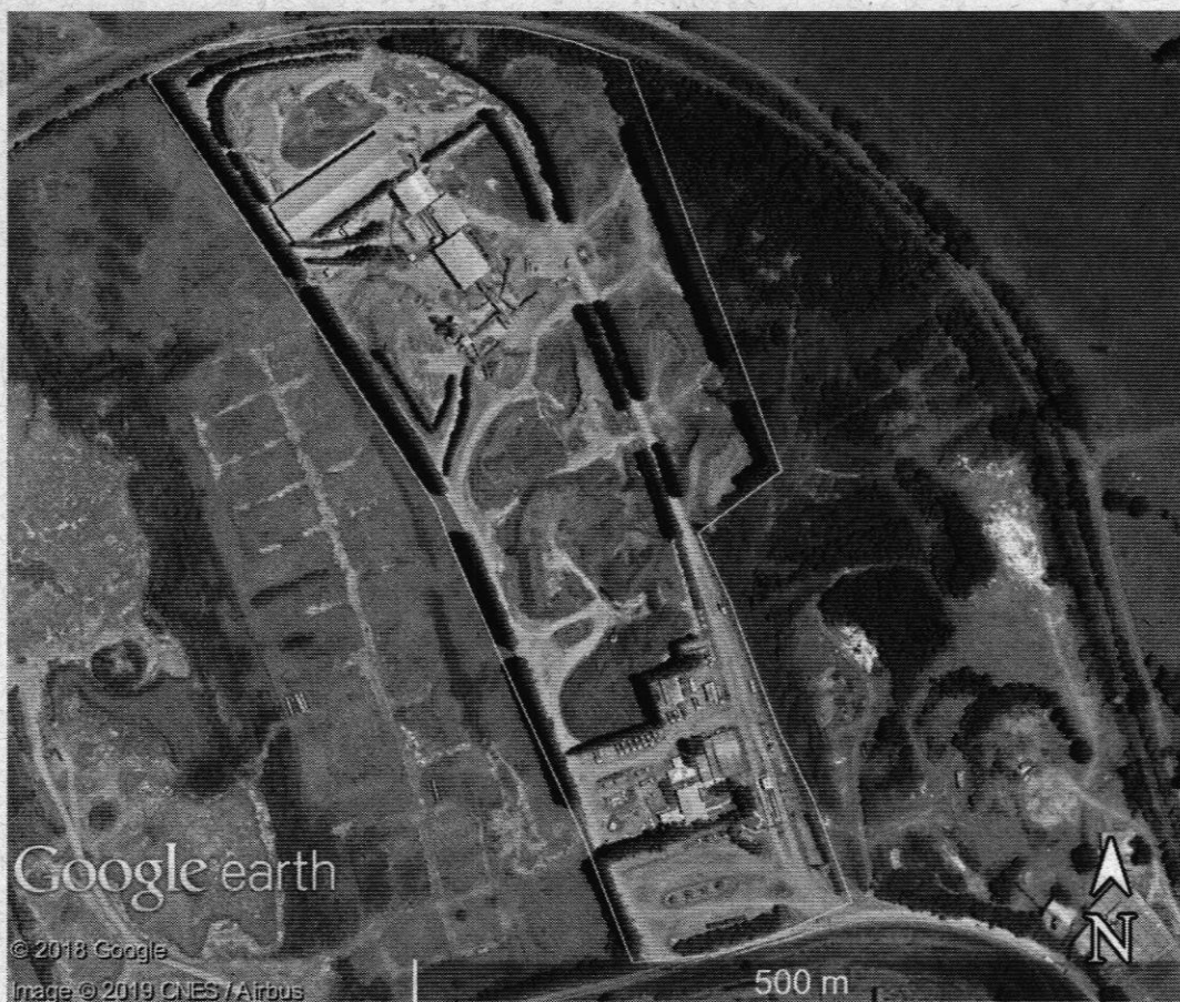
Figura 1: Imagem de satélite do empreendimento Minasol, em amarelo.

Os equipamentos utilizados no processo industrial são: