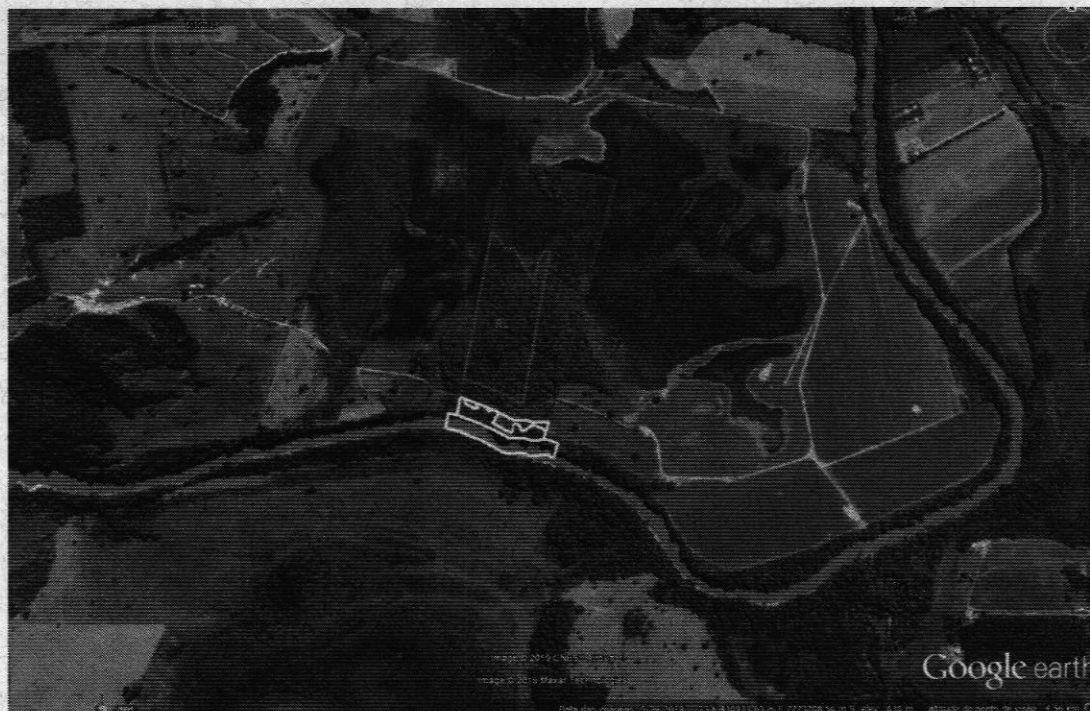
Figura 02: Polígono da área de Reserva Legal localizada no imóvel de matrícula nº 4.989.

De acordo o processo administrativo nº 05359/2010 (APEF/AIA), vinculado ao processo de licenciamento anterior, que regularizou as áreas de RL dos referidos imóveis, foi constatado que a área de Reserva Legal perfaz o quantitativo 02.16,00 hectares, equivalente a 20% da área total do imóvel (matrícula nº 17.068), localiza-se de forma contígua (gleba única), com a área de RL do imóvel receptor (matrícula nº 4.989), conforme pode ser observado na imagem abaixo: