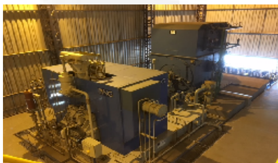
Foto 03. Geração de energia termoeletrica