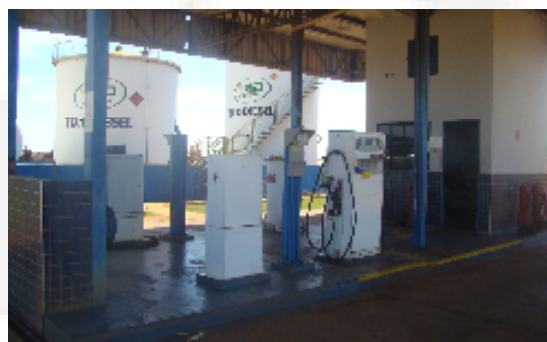
Foto 04. Ponto de combustível