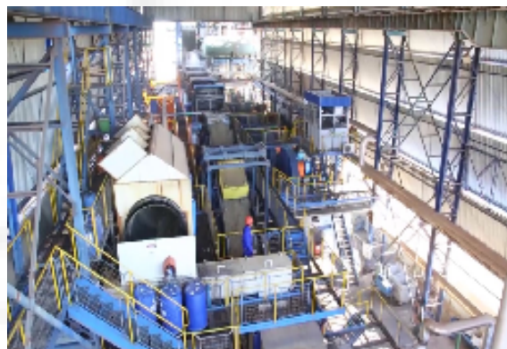
Foto 02. Área de produção