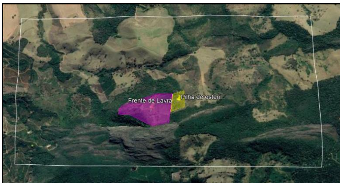
Figura 02 – Frente de lavra e pilha de estéril apresentada nos estudos pelo empreendimento

Pode observar que a figura 2 já demonstra que a atividade, principalmente a lavra está localizada fora da propriedade informada no processo de licenciamento ambiental