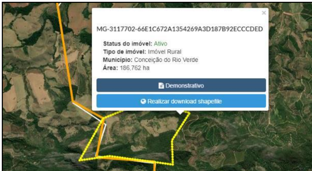
Figura 05 – Maior parte propriedade localizada no município de Conceição do Rio Verde – MG

atividades serão desenvolvidas no município.