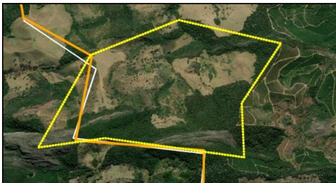
Figura 03 – Localização do imóvel Fazenda Boqueirão – Matrícula nº 3958 em sua maior parte no município de Conceição do Rio Verde