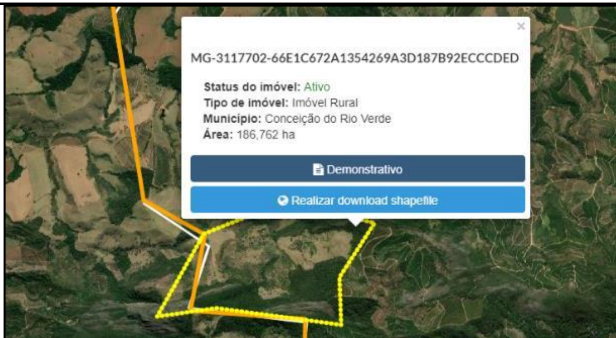
Figura 04 – CAR da propriedade Fazenda Boqueirão.