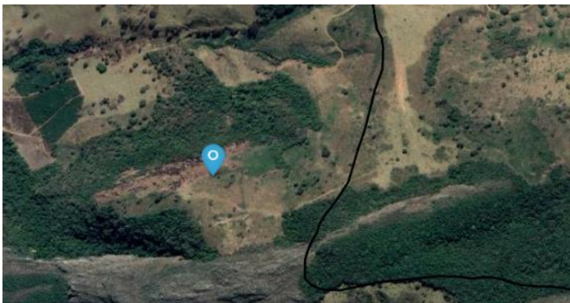
Figura 01 – Coordenadas geográficas do empreendimento no município de Jesuânia

Foi apresentada Certidão de Microempresa do empreendimento.