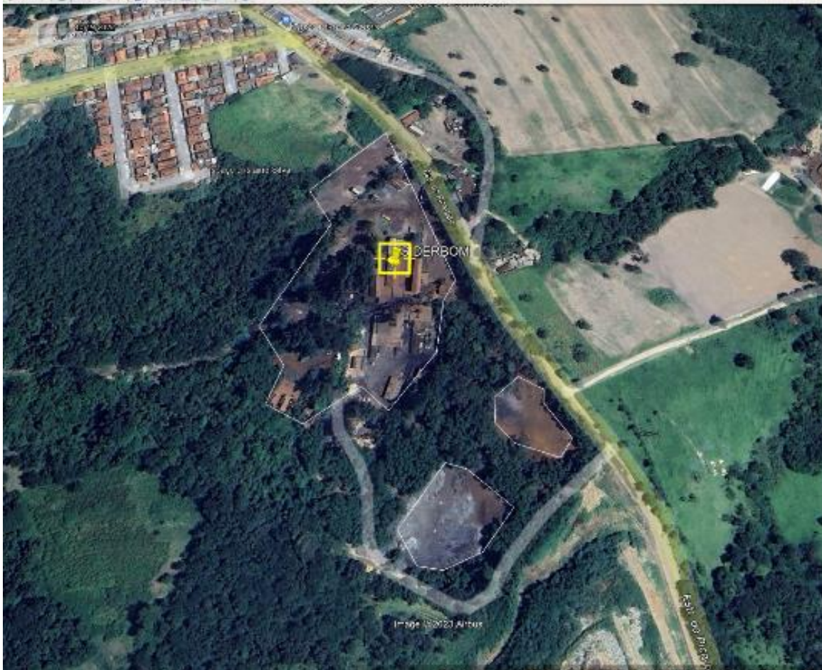
Fig. 01 – Imagem de satélite da empresa.

No processo de revalidação em análise é considerada a seguinte atividade: