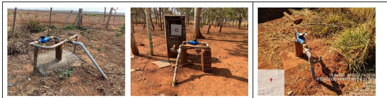
Foto 9. Fotos dos pontos de captações declarados.

Fonte: RCA, 2022. Processo SLA 4062/2022.