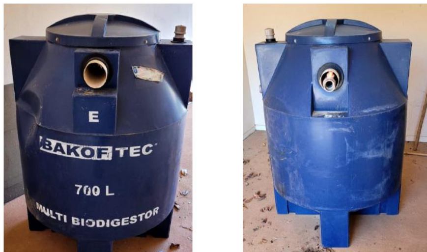
Foto 10. Fossas biodigestores a serem instaladas para tratamento dos efluentes sanitários.