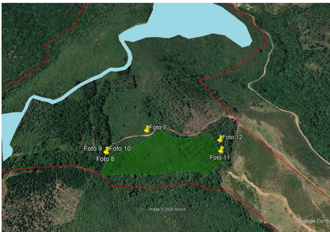
Figura 02: Área proposta para Relocação da Reserva Legal (verde); Parte da ADA (azul); Limite do imóvel Morro do Zé Thoma (vermelho) e Marcadores com as coordenadas constantes nas fotos apresentadas (amarelo).

Dessa forma, foi promovido o lançamento, via Google EarthPro, das coordenadas geográficas presentes nas fotos constantes no referido laudo técnico, sendo constatado que, para as fotos 7 a 12, que tratam da área proposta para relocação, as mesmas não se encontram inseridas na referida área , conforme se visualiza na Figura 02, a seguir.