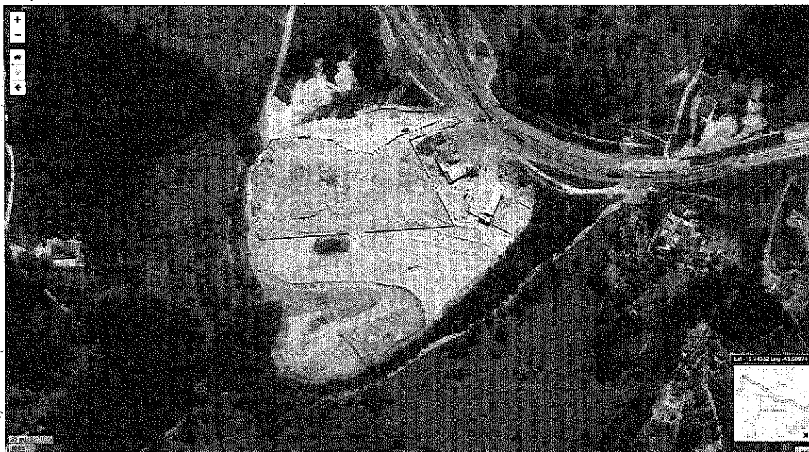
Figura 01: Imagem da plataforma IDE com a área da propriedade rural onde se localiza o empreendimento

Sistema Estadual de Meio Ambiente e Recursos Hídricos - Minas Gerais