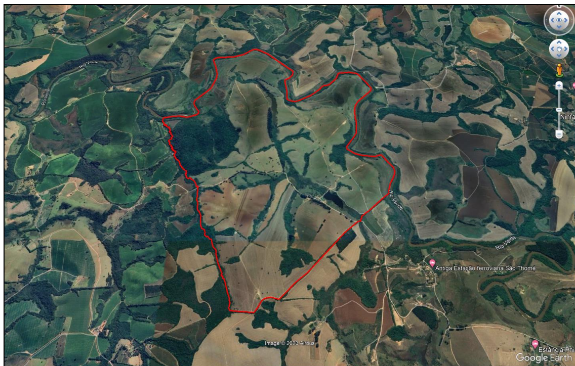
Figura 1 – Localização do empreendimento e seu entorno.