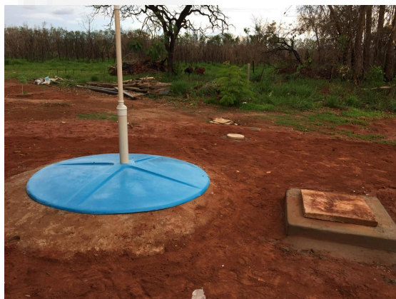
Foto 03. Sistema de tratamento de efluentes sanitários