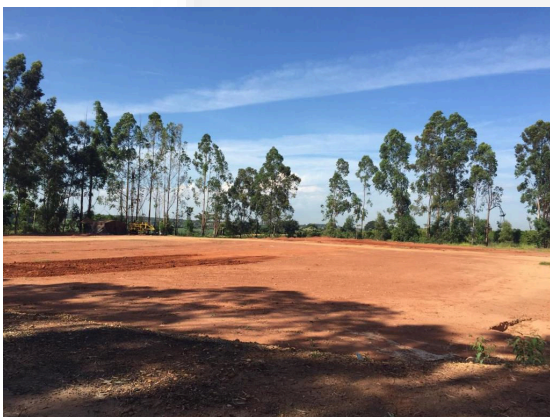
Foto 01. Local de instalação da usina de tratamento térmico de resíduos

Empreendedor: TERMOAMBIENTAL ENERGIA LTDA Empreendimento: TERMOAMBIENTAL ENERGIA LTDA CNPJ: 21.606.000/0001-00 Município: UBERLÂNDIA-MG Atividade: TRATAMENTO TÉRMICO DE RESÍDUOS TAIS COMO INCINERAÇÃO, PIRÓLISE, GASEIFICAÇÃO E PLASMA Código DN 217/17: F-05-13-4 Processo: 25781/2016/002/2019 Validade: 06 anos