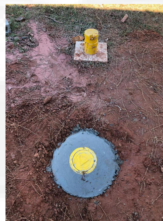
Foto 04. Piezômetro