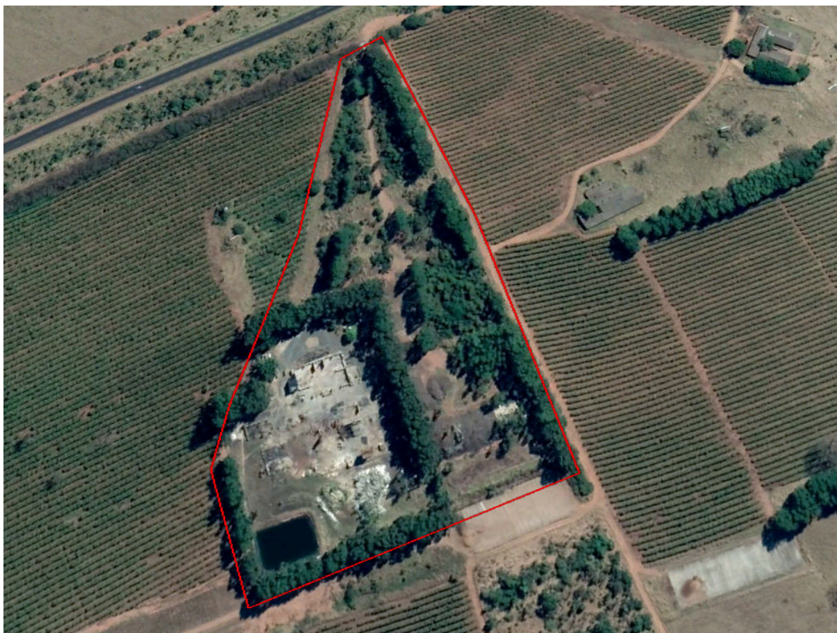
Figura 01: Localização do empreendimento.

A atividade fim desse licenciamento consiste no tratamento térmico de resíduos Classe I, sendo a tecnologia compatível também para o tratamento de resíduos classe II e III, conforme estudos apresentados. A incompatibilidade do tratamento está restrita aos seguintes resíduos: metálicos, resíduos radioativos, resíduos com alta concentração de metais pesados, pneus, baterias, resíduos com conteúdo superior a 2% de cloro, sendo a listagem completa apresentada no EIA.