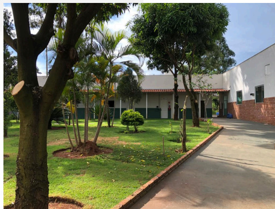
Foto 02. Área administrativa