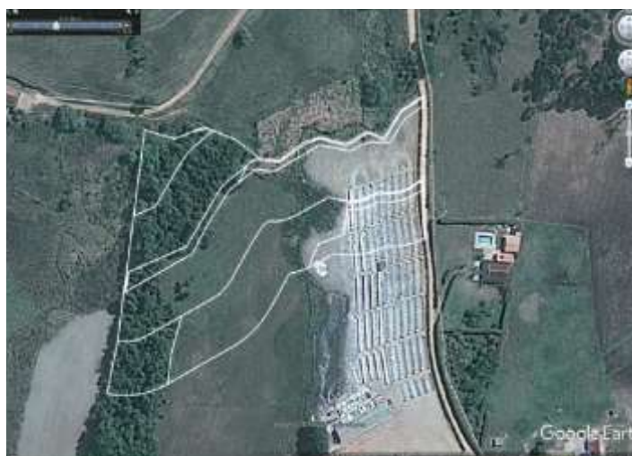
FIGURA 03 - POLVILHO ASA BRANCA NO ANO DE 2012