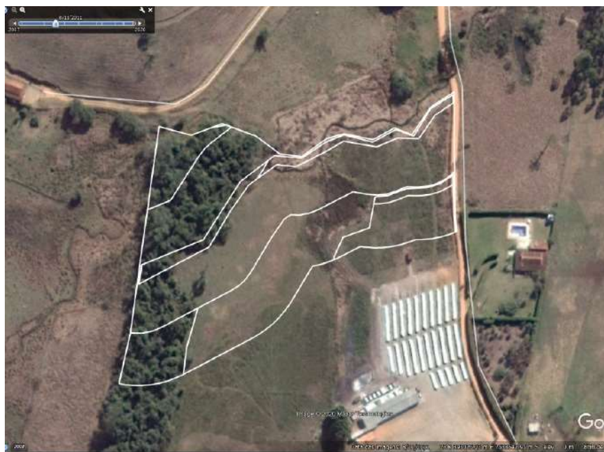
FIGURA 02 - POLVILHO ASA BRANCA NO ANO DE 2011