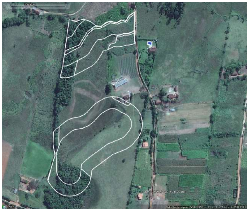
FIGURA 01 - POLVILHO ASA BRANCA NO ANO DE 2010