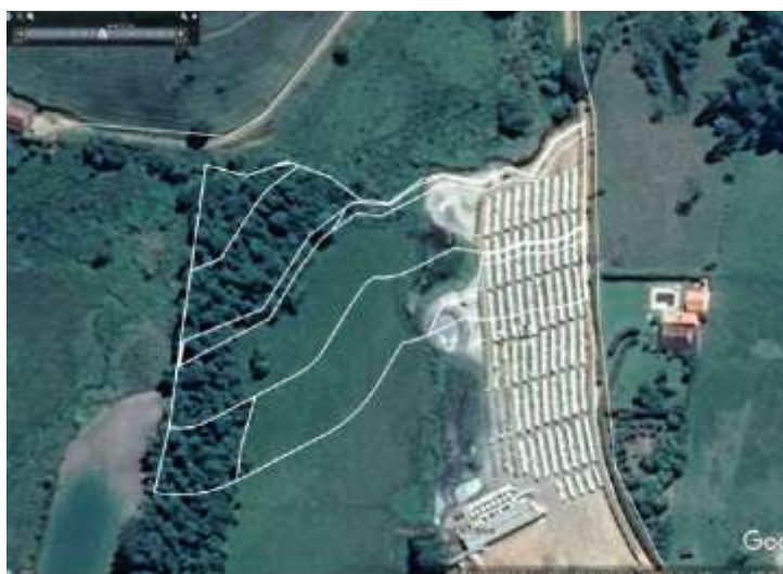
FIGURA 04 - POLVILHO ASA BRANCA NO ANO DE 2014