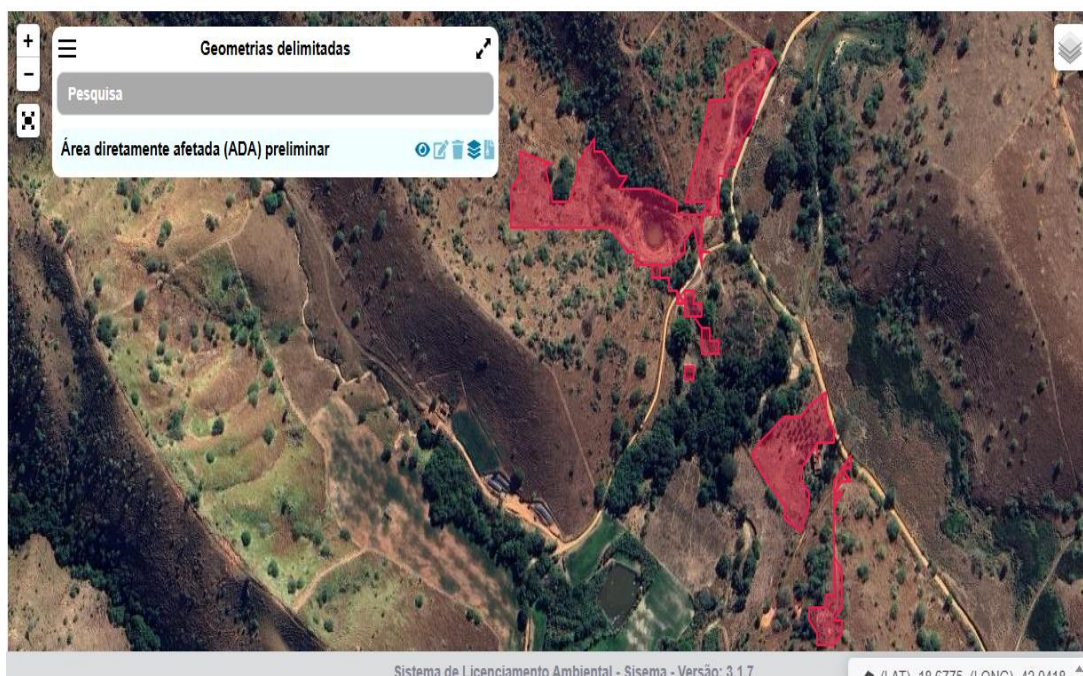
Figura 1. Localização do empreendimento JOSÉ PEDRA JUNIOR.

O responsável pelo empreendimento, JOSÉ PEDRA JUNIOR, atua no ramo da mineração, especificamente na extração de pegmatitos e gemas, exercendo suas atividades na Fazenda Montes Claros, s/nº, distrito de Chonin, zona rural do município de Governador Valadares-MG, cujas coordenadas geográficas do ponto central tem como coordenadas geográficas: Latitude 18° 40' 39,41" S e Longitude: 42° 02' 26,72" W - SIRGAS 2000 (Figura 1). Está inserido nas poligonais dos processos ANM/DNPM n.º 832.593/2013 (fase Lavra Garimpeira) para as substâncias Berilo, Turmalina, Feldspato e Quartzo; e 831.741/2014 (fase Requerimento de Lavra) para as substâncias Quartzo, Turmalina, Feldspato e muscovita, sendo as áreas concedidas de 24,19 ha e 49 ha, respectivamente.