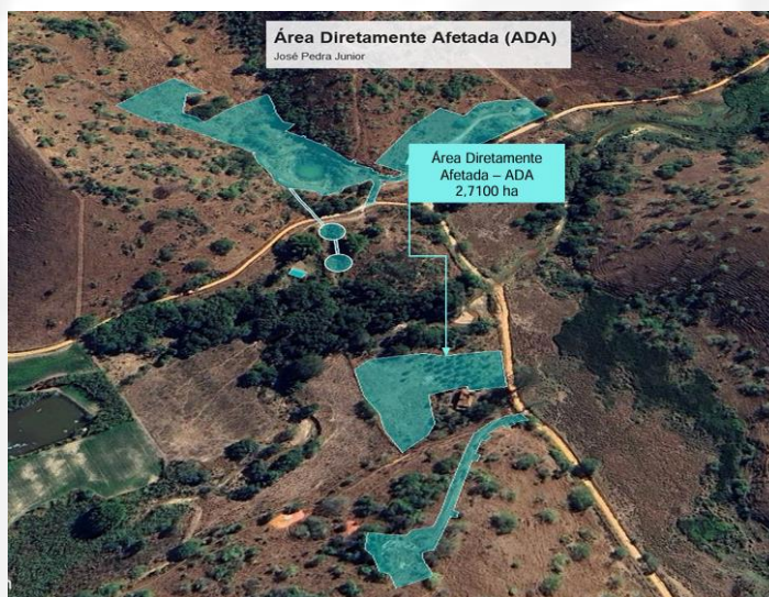
Figura 3. Delimitação da Área Diretamente Afetada - ADA pelo empreendimento.

A Área Diretamente Afetada ADA pelo empreendimento, informada nos Autos do Processo (Figura 3), possui 2,7100 ha, sendo 1,1848 ha referente à área de lavra, 1,2125 ha à pilha de rejeito, 0,0091 ha à área de vivência.