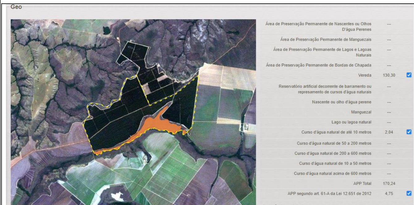
Figura 1. Vereda representada na cor laranja com área total de 130,30 ha. Pesquisa realizada em 17/03/2021.