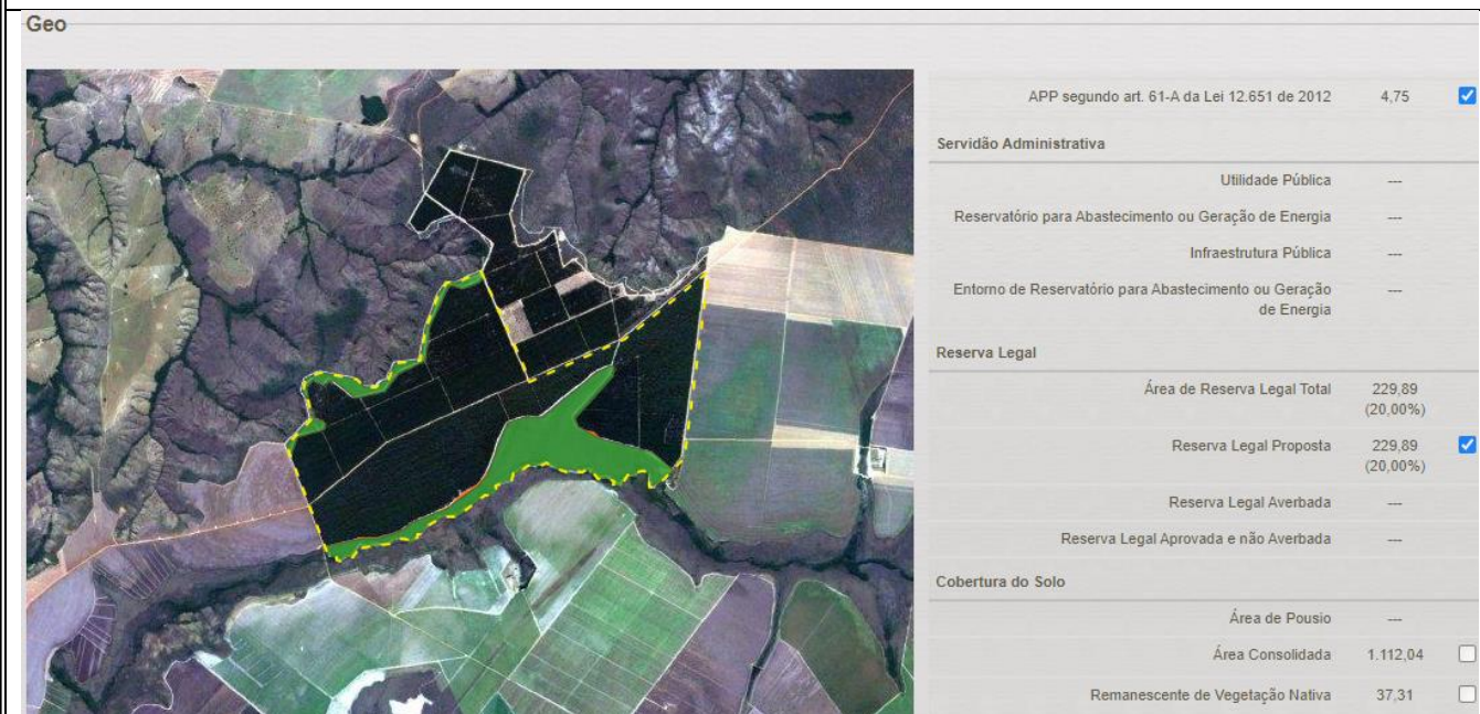
Figura 2. Demarcação de RL sobreposta a área de Vereda. Pesquisa realizada em 17/03/2021.