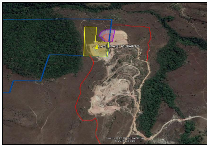
Imagem 01: Área de lavra em amarelo, estradas em vermelho e Pilhas em Lilás e Vermelho

Foi verificado pelo IDE e pelas imagens de satélite que o avanço de lavra (área em amarelo) se dará em área de vegetação nativa (campo), sendo necessária supressão de vegetação para o avanço da lavra e para a construção das estradas que darão acesso às atividades de lavra e pilha. Em virtude dessa constatação, o empreendimento deveria ter apresentado DAIA (Documento Autorizativo para Intervenção Ambiental) prévio para a formalização da licença ambiental.