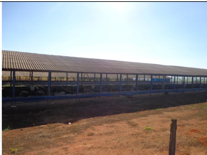
Galpões de suínos