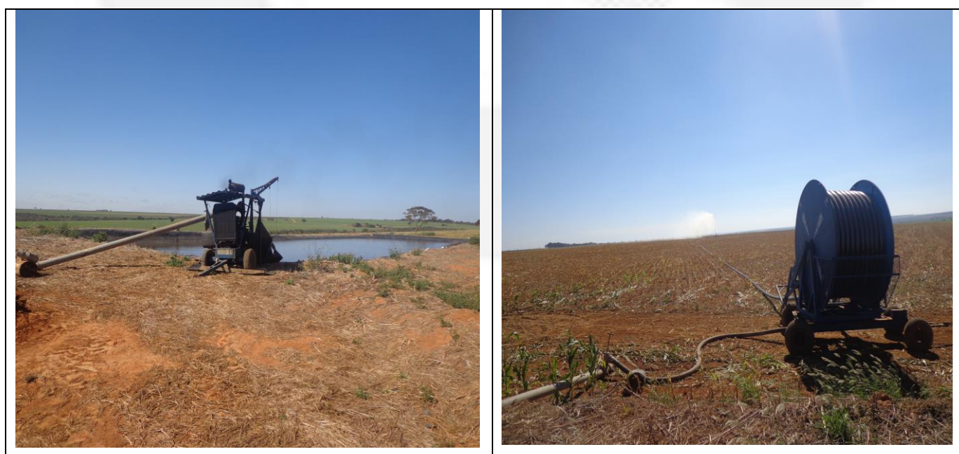
Figura 02 – Sistema de aplicação de dejetos de suínos.

A capacidade máxima de alojamento de suínos dentro do imóvel é igual a 21.800 animais e estima-se uma produção de dejetos de 163,5 \text{ m}^3 \text{ dia}^{-1} de dejetos. Após as lagoas de polimento, o efluente é aplicado em área de pastagem e áreas ocupadas com culturas anuais via sistema de aspersão (autopropelido), figura 02.