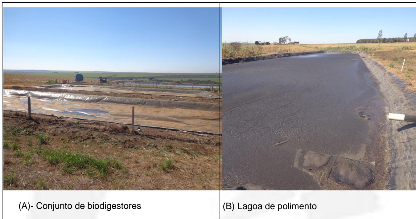
Figura 01 – Sistema de tratamento de efluentes da suinocultura

Vale salientar que recentemente o empreendedor realizou manutenção em todos os biodigestores do empreendimento. Portanto, ainda não acumulou gases a ponto de inflar a lona de PEAD (Polietileno de Alta Densidade) - figura 01.