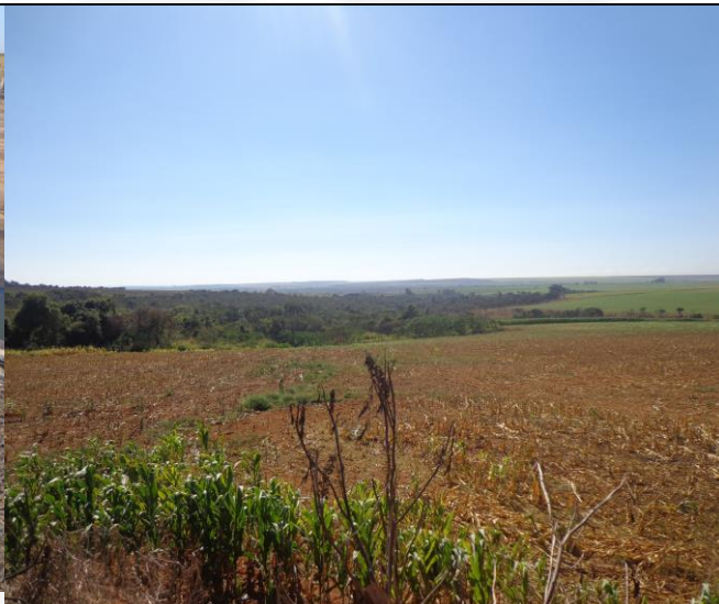
Área de reserva legal (área de cerrado)