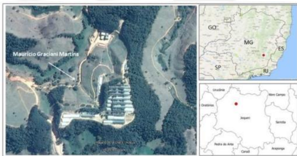
Figura 1 – Localização do empreendimento.

O empreendimento denominado Maurício Graciani Martins, compreende a granja sítio Areal, localizado na zona rural do município de Jequeri/MG, nas coordenadas geográficas de 20°24'53" de latitude sul e 42°39'40" de longitude oeste, Datum WGS 84. (Figura 1).