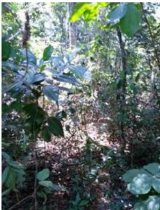
Figura 8 – Interior do remanescente FESD em estágio médio, vizinho à área em que houve supressão. Coordenadas: 20°24'55,41"S/42°39'35,34"O (datada de 24/01/2019).