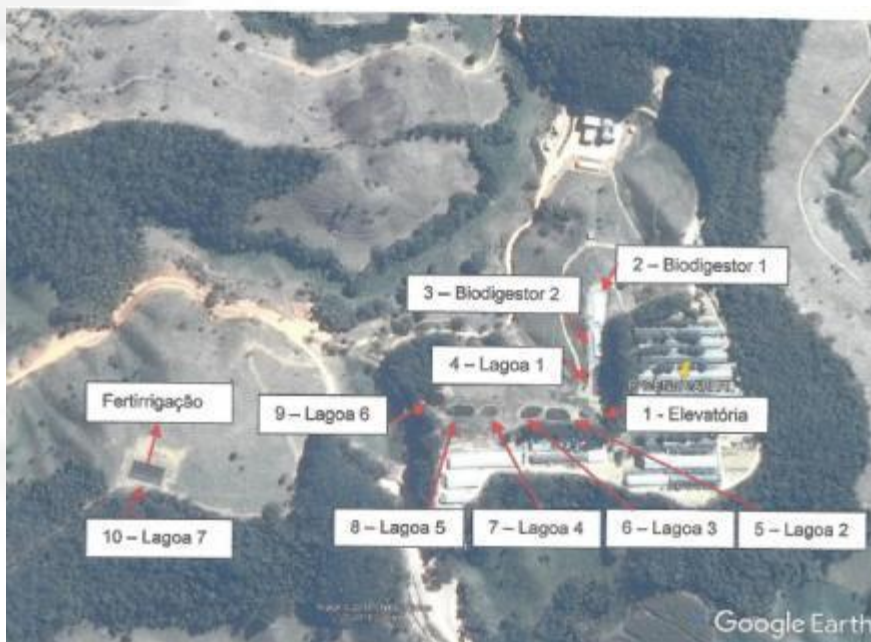
Figura 9 – Ilustração do sistema de tratamento de efluentes instalado no empreendimento, com vista aérea do sistema.

Para quantificar o valor fertilizante do efluente, amostras coletadas na última lagoa anaeróbia serão encaminhadas para análises envolvendo os parâmetros: pH, N total, N amoniacal, P total, K, Zn, Óleos e Graxas e Cu. Assim, a lâmina aplicada será em função do valor fertilizante do efluente, da dimensão da área, do resultado da análise do solo e das exigências da cultura. Para assegurar o equilíbrio entre as quantidades de nutrientes retiradas e absorvidas pelas plantas, ficará determinado como condicionante, no ANEXO I deste Parecer Único, a realização do referido automonitoramento em conformidade com um laudo técnico de manejo de fertilirrigação.