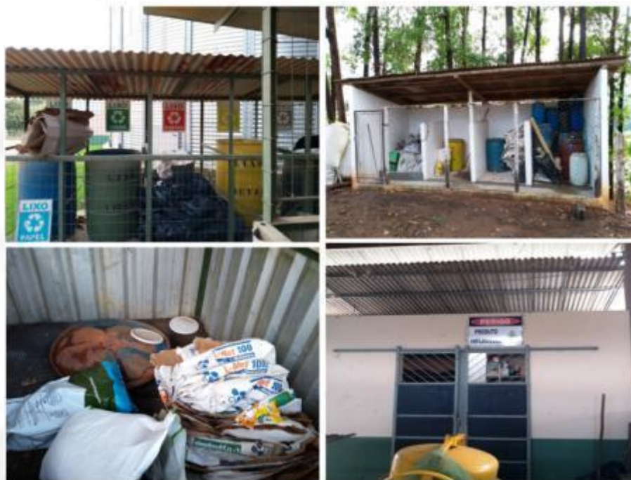
Figura 10 – Depósitos de resíduos sólidos e Classe I e Classe II.

drenos de chorume, precedido de um desidratador. (Figura 11). O composto orgânico gerado no final do processo é utilizado como adubo na propriedade.