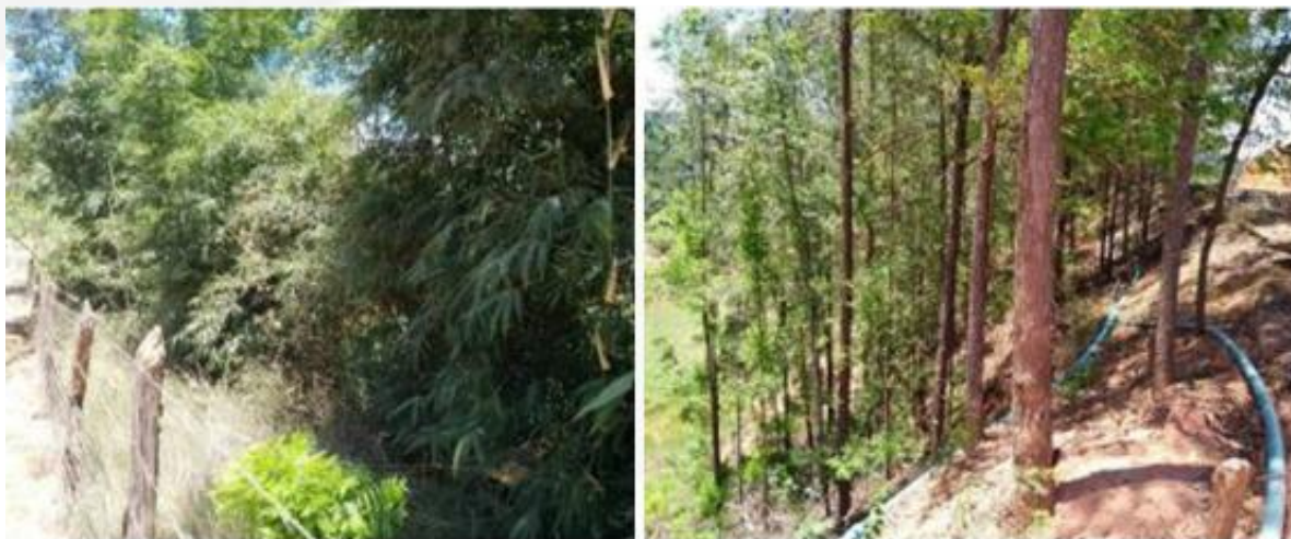
Figura 7 – A esquerda, remanescente do plantio de bambu. Coordenadas: 20^{\circ}24'58,83''S/42^{\circ}39'50,33''O (datada de 24/01/2019). A direita Remanescente de plantio de eucalipto, vizinho à área em que houve supressão. Coordenadas: 20^{\circ}24'58,04''S/42^{\circ}39'50,21''O (datada de 24/01/2019).