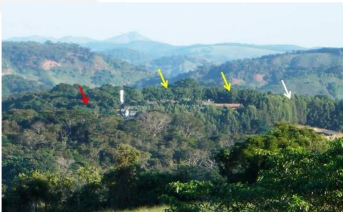
Figura 6 – Fotografia datada de 01/05/2004, apresentada pelo empreendedor, demonstrando nas setas vermelhas a área composta por FESD em estágio médio ( 20^{\circ}24'53,36''S/42^{\circ}39'37,65''O ), setas amarelas plantio de bambu ( 20^{\circ}24'57,21''S/42^{\circ}39'43,40''O ) e setas brancas plantio de eucalipto ( 20^{\circ}24'58''S/42^{\circ}39'51''O ) que foram suprimidas.