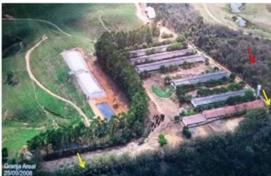
Figura 5 – Fotografia aérea datada de 25/09/2008, apresentada pelo empreendedor, demonstrando nas setas vermelhas a área composta por FESD em estágio médio (20°24'53,36"S/42°39'37,65"O), setas amarelas plantio de bambu (20°24'57,03"S/42°39'05"O e 20°24'56,63"S/42°39'47,13"O) que foram suprimidas.

As Figura 5 a Figura 8 ilustram os locais em que houve supressão de vegetação, em que também é possível observar o uso e ocupação do solo existente no passado, anterior a realização da referida supressão.