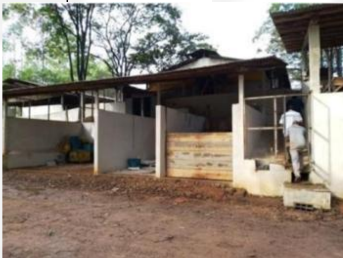
Figura 11 – Câmaras de compostagem, composta com canaleta e caixa de recolhimento de chorume.