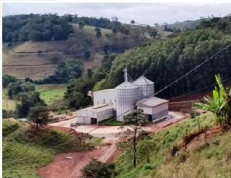
Figura 3 – Fabrica de formulação de rações balanceadas.

As sacarias e embalagens são separadas e acondicionadas em depósito próprio para essa finalidade, parte dela é reaproveitada dentro do próprio empreendimento e o restante descartado junto com outros resíduos sólidos inerentes ao empreendimento.