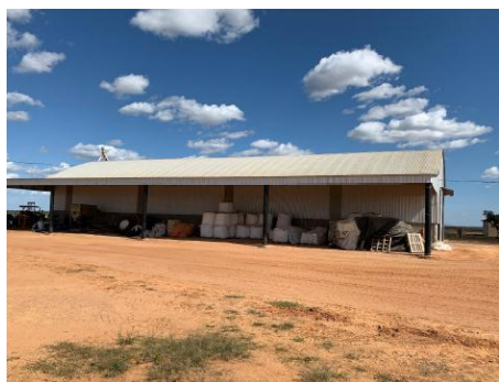
Figura 03. Galpão