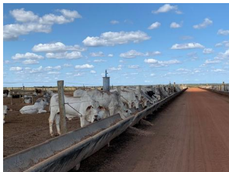
Figura 02. Área de confinamento