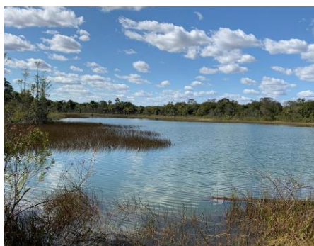
Figura 04. Área de reserva legal