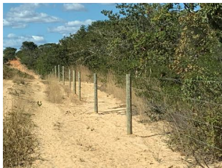
Figura 01. Área de reserva legal cercada