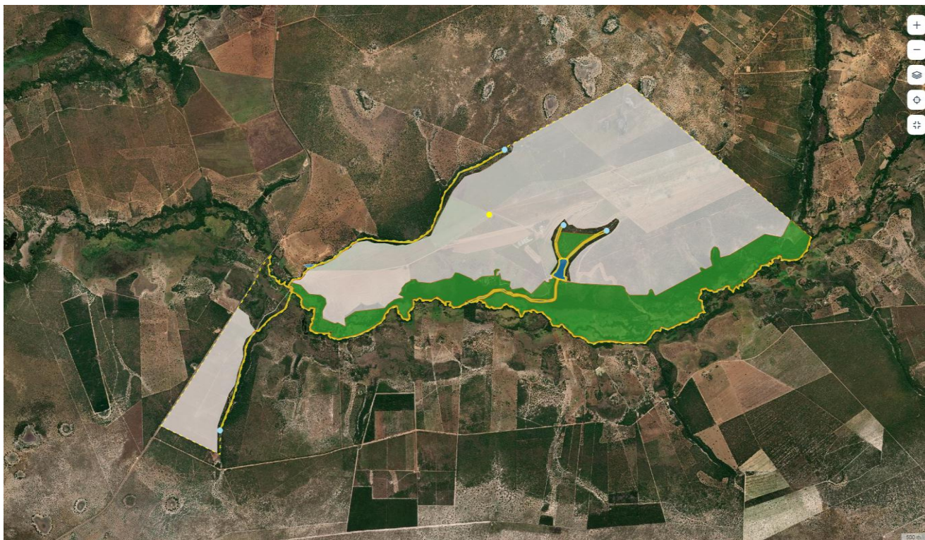
Figura 02. Áreas de Reserva Legal do empreendimento conforme consta no CAR. Acesso em 07/06/2022.

valores reais do mapa da propriedade juntado aos autos.