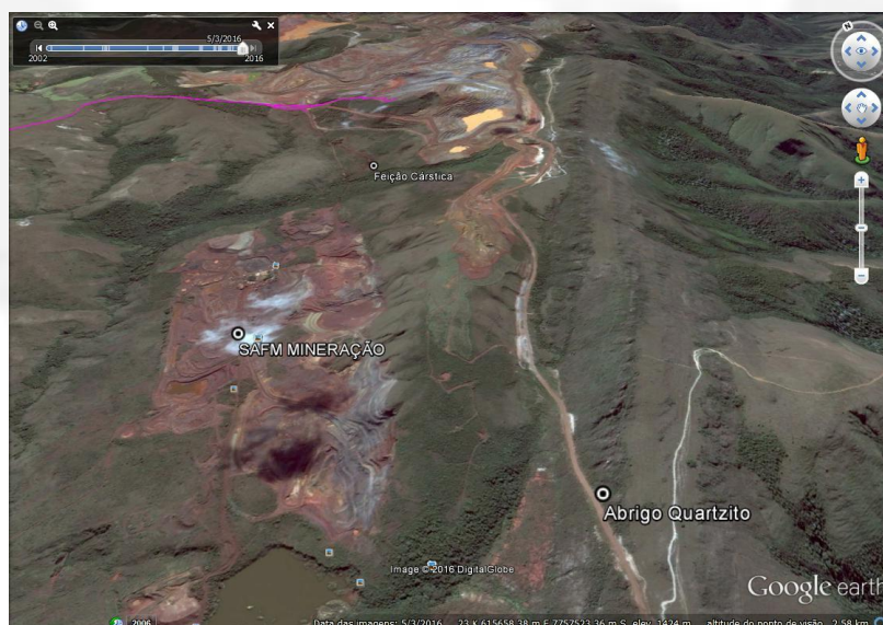
Figura 6: ADA do empreendimento e as cavidades identificadas no entorno.

No caminhamento espeleológico realizado foram identificadas duas feições cársticas fora da área do empreendimento e do seu entorno de 250 metros, conforme imagem abaixo: