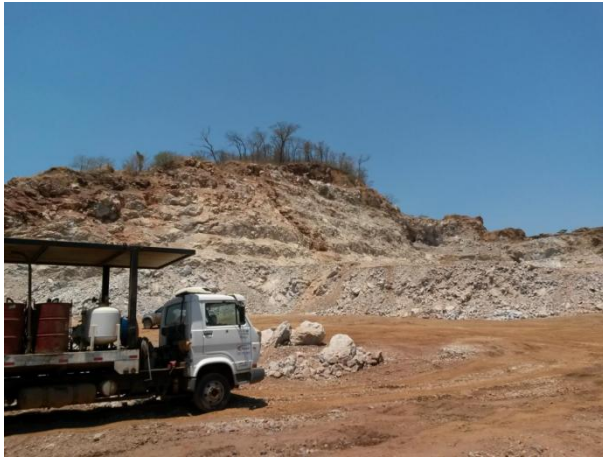
Foto 01. Área de Lavra