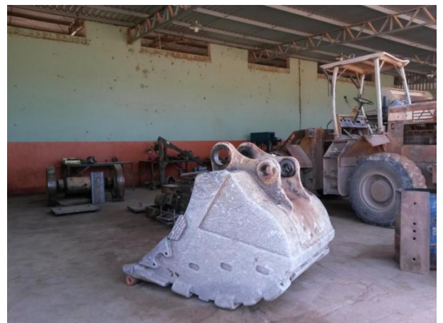
Foto 04. Oficina