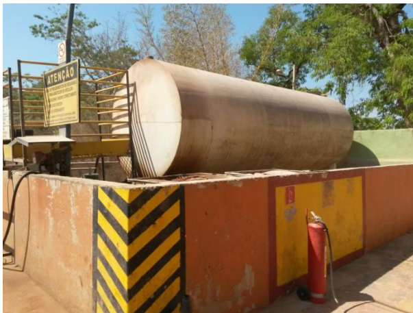
Foto 03. Ponto de abastecimento