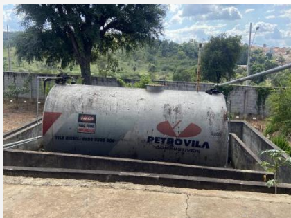
Foto 03. Tanque aéreo