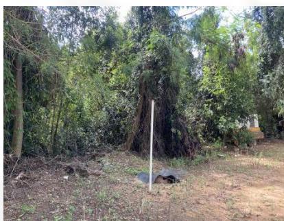
Foto 06. Fossa séptica