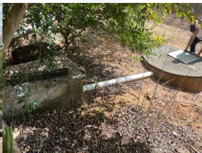
Foto 04. Caixa SAO