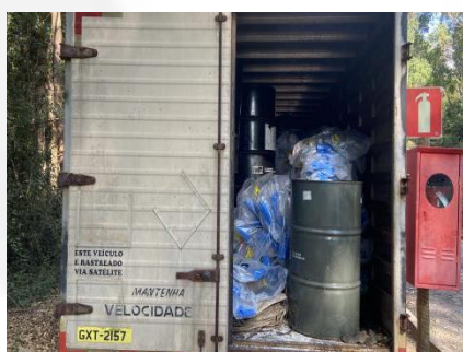
Foto 05. Depósito temporário de resíduos