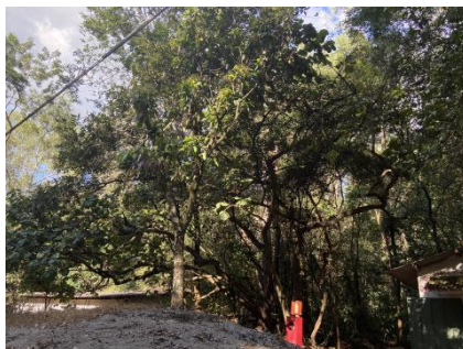
Foto 01. Vista geral