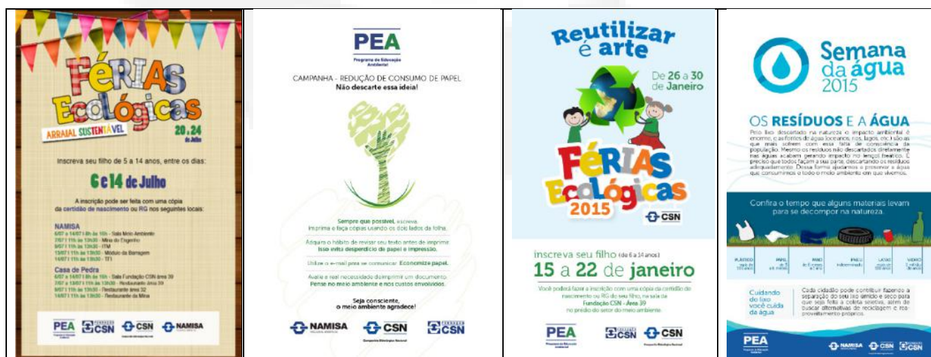
Figura 2: Divulgação de ações vinculadas ao PEA.

Para o público interno, além das atividades pontuais realizadas nas datas comemorativas ambientais de relevância (Dia da Água, Dia do Meio Ambiente e Dia da Árvore), são trabalhadas várias ações de conscientização de modo a desenvolver, com os funcionários próprios e contratos, conhecimentos sobre aspectos, impactos e riscos ambientais que possibilitem atitudes individuais e coletivas de mitigação, conservação e respeito ao Meio Ambiente, no desenvolvimento de suas atividades profissionais e cotidianas.