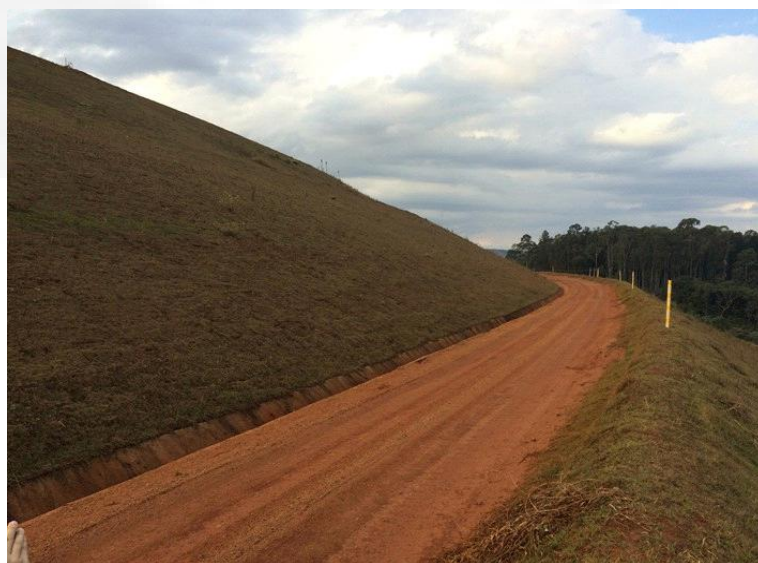
Figura 7. Cobertura vegetal no talude a jusante do barramento.

O talude de montante - interno, de contato com rejeito e água - possui revestimento de uma camada de laterita como forma de proteção contra as oscilações do nível de água do reservatório. O talude de jusante, por sua vez, recebe revestimento vegetal por gramas em placas (Figura 2), evitando processos erosivos.