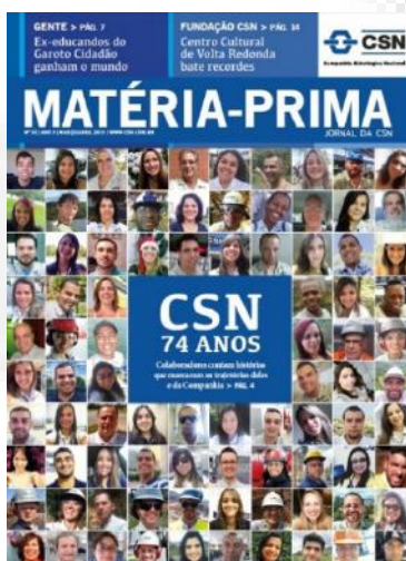
Figura 3: Periódico.

Em relação à mídia impressa o empreendedor apresentou os seguintes periódicos: