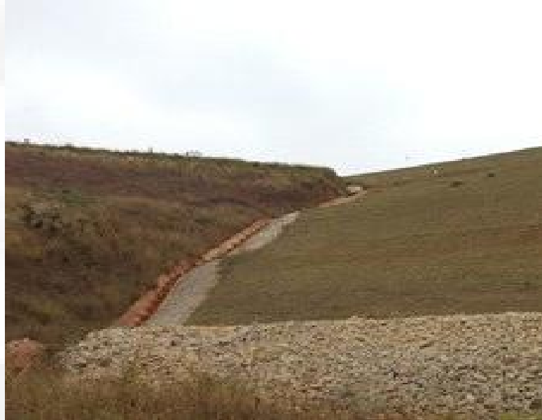
Figura 8. Drenagem na ombreira esquerda da Barragem Casa de Pedra.

Com relação à drenagem externa, os encontros das ombreiras apresentam descidas de água em concreto, canaletas trapezoidais nas bermas e descidas em degraus, como pode ser visto na Figura 3. O sistema de drenagem superficial instalado na barragem e dique de sela é composto por canaletas de bermas e canais periféricos, ambos em concreto armado.