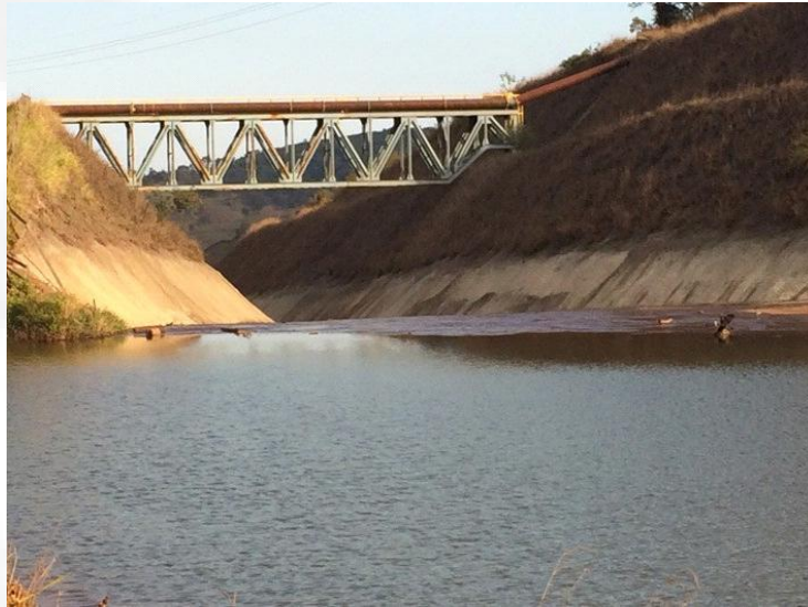
Figura 9. Visão frontal do extravasor