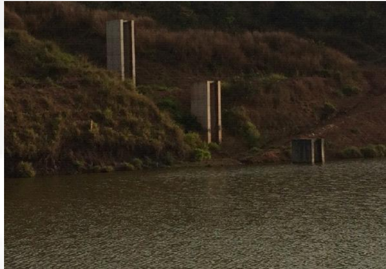
Figura 11. Tulipas.

Para esclarecimentos, as tulipas consistem em torres de concreto armado construídas dentro do reservatório que possuem "janelas" que possibilitam o controle da altura do nível da água contida no mesmo.