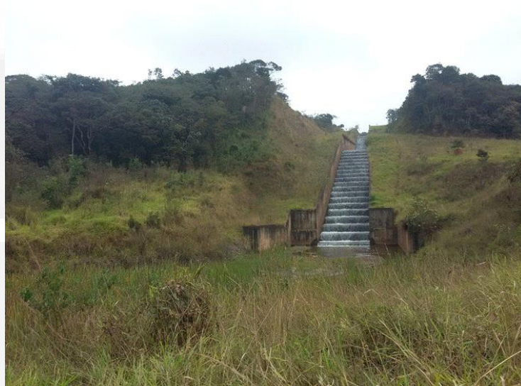
Figura 10. Canal extravasor. Vista da descida em degraus.

Para esclarecimentos, o sistema extravasor de uma barragem visa, basicamente, permitir o escoamento da vazão máxima de enchente e a proteção do local de restituição das águas vertidas ao curso d'água.