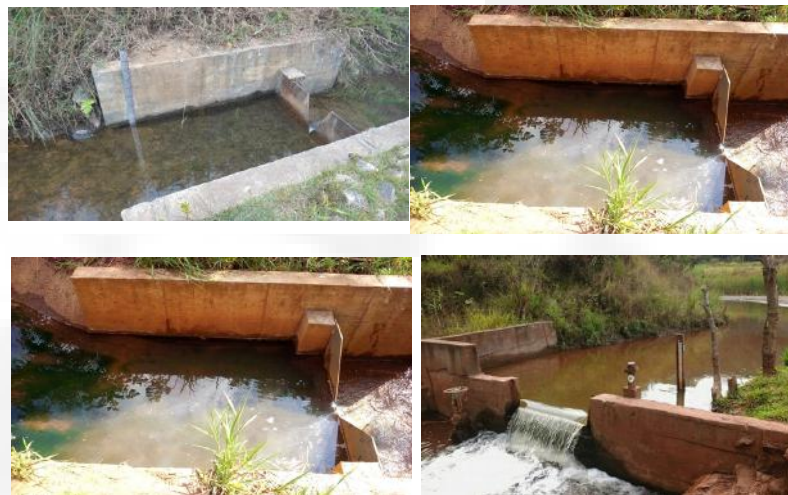
Figura 6. Medidores de vazão. Barragem Casa de Pedra.

Para o monitoramento das vazões percoladas pelo sistema de drenagem interna do maciço e fundação, a barragem Casa de Pedra conta com 03 (três) vertedouros triangulares localizado à jusante do dreno de “pé” da barragem nas estacas 35, 24, à jusante da seção principal do Dique de Sela. Também possui o vertedouro triangular a jusante do canal extravasor para medir a vazão de restituição ao córrego Figueiredo conforme ilustrado na Figura 1.