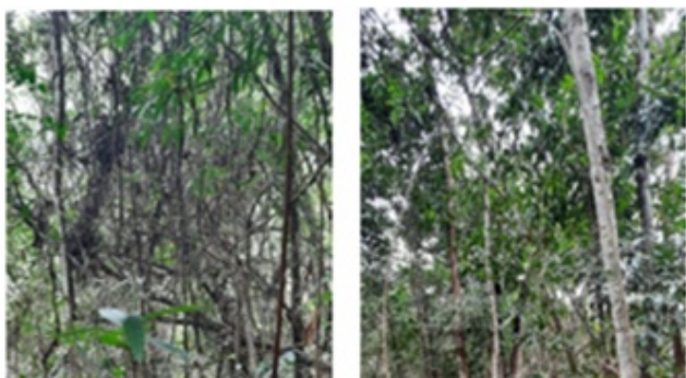
Figura 2. Vegetação presente nos locais de supressão de vegetação nativa (diferentes espessuras de diâmetro e altura).

Para subsidiar a análise das intervenções ambientais requeridas foi realizada vistoria no dia 29/08/2023 (Auto de Fiscalização n. 49/2023 – Id. 72602885, respectivo ao Processo SEI 1370.01.0040962/2023-90). Durante a vistoria de campo percorreu-se parte da ADA do empreendimento a fim de verificar-se o local destinado às instalações, bem como a localização das parcelas do inventário florestal, árvores isoladas e plantio de eucalipto. Porém só foi possível identificar a localização exata de uma das três parcelas inventariadas , caracterizada como Floresta Estacional Semidecidual em estágio inicial de regeneração. Durante o percurso verificou-se que a vegetação nativa existente no local da intervenção não se mostrava homogênea em relação ao estágio de regeneração, uma vez que havia vegetação tipo paliteiro até árvores frondosas que alcançavam grandes dimensões (Figura 2), indicando que havia remanescente de vegetação em mais de um estágio de regeneração.