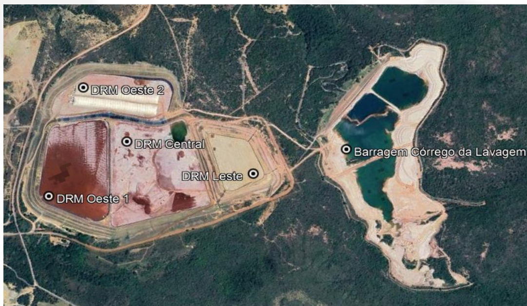
Figura 01: Módulos do Depósito de Rejeitos Murici (DRM) e BCL.

A Nexa possui um conjunto de 4 (quatro) barragens/módulos adjacentes (Leste, Central, Oeste 1 e Oeste 2), denominado Depósito de Rejeitos Murici (DRM). Essas estruturas têm como finalidade disposição dos rejeitos da planta industrial de produção de zinco. Os quatro módulos possuem características técnicas específicas e contam com sistema de impermeabilização do reservatório, constituído por geomembrana de Polietileno de Alta Densidade – PEAD. A figura 01 mostra a configuração dos módulos do DRM e a Barragem Córrego da Lavagem (BCL).