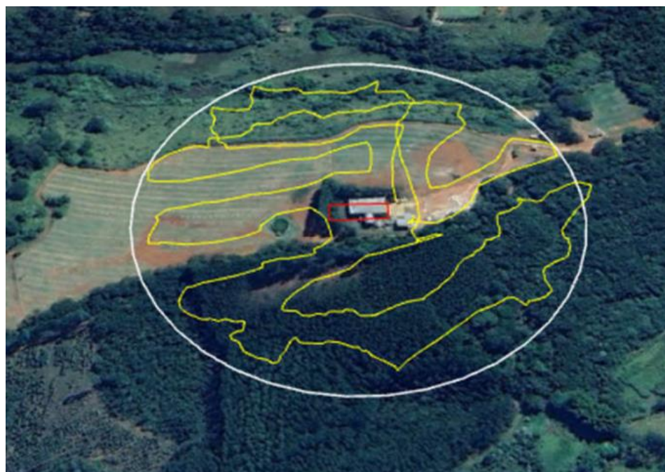
Figura 1: Caminhamento (linha amarela) realizado durante a prospecção espeleológica.

O local de implantação do empreendimento é considerado com potencial muito alto para ocorrência de cavidades naturais, com fator locacional 1. Por isso, foi apresentado estudo de prospecção espeleológica na Área Diretamente Afetada (ADA), acrescida de uma faixa de 250 m, totalizando 16,56 ha. Esse levantamento foi realizado em 28/08/2023. A figura abaixo mostra o caminhamento realizado. Durante o levantamento não foi encontrada nenhuma cavidade.