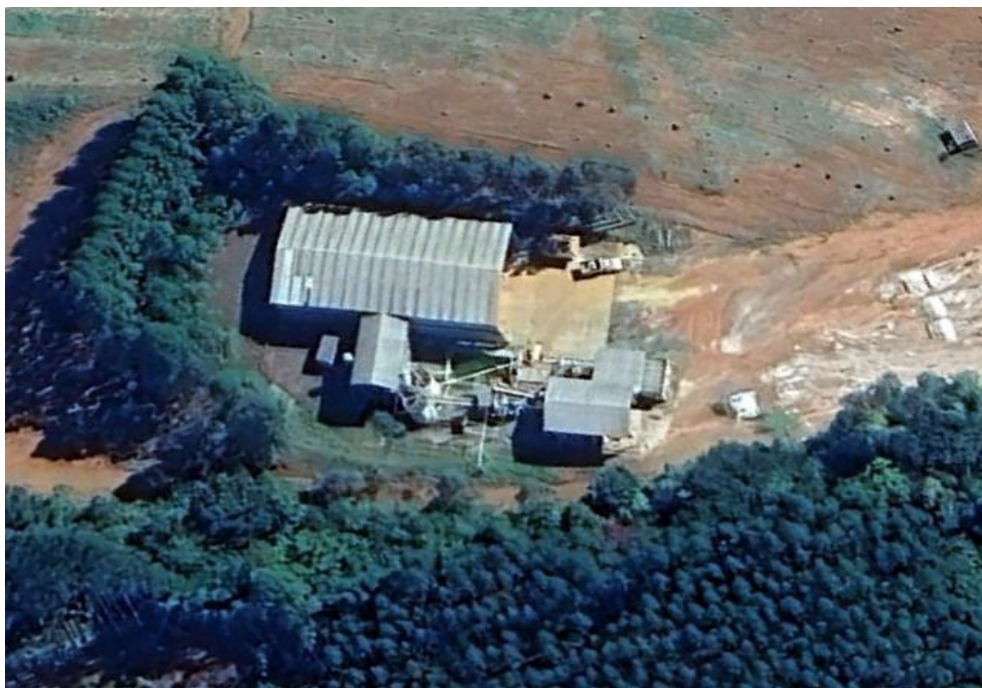
Figura 2: Área solicitada para operação do empreendimento.

Trata-se de um empreendimento novo que pretende se instalar em local que já possui uma infraestrutura construída. O local conta com duas linhas de produção iguais, compostas por moega de alimentação, forno rotativo, reservatório de material, esteira, moinho e peneira, elevatória e silo de material acabado. A Figura 2 é uma imagem aérea do local e a Figura 3 um esquema das linhas de produção.