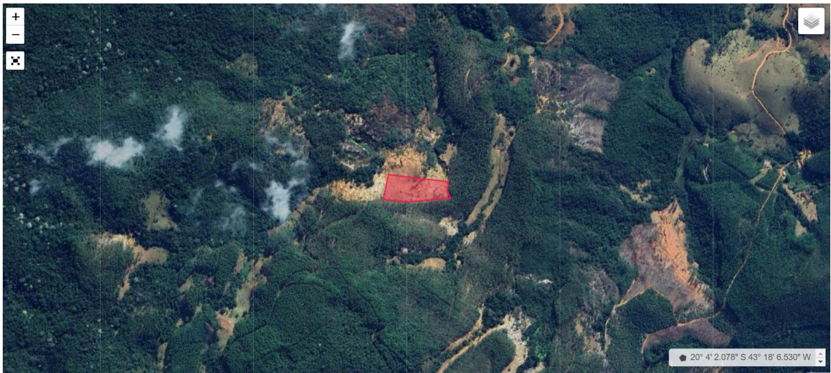
Figura 01. Localização do empreendimento.

A Portaria do Departamento Nacional de Pesquisa Mineral – DNPM nº. 155/2016 estabelece que, para emissão do título minerário, é obrigatória a apresentação da licença ambiental. Ademais, a DN COPAM n. 217/2017 prima por licenciamentos concomitantes. Assim, o art. 23 da referida deliberação pretende que as atividades minerárias sejam analisadas exclusivamente no aspecto ambiental, sendo de responsabilidade do empreendedor buscar o título minerário após a aquisição da licença.