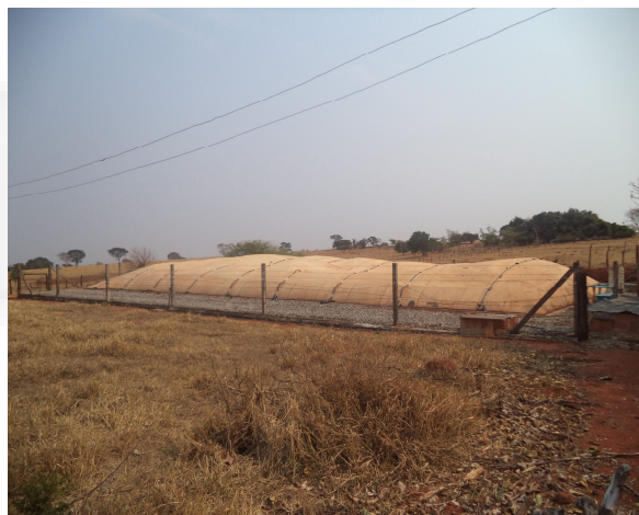
Foto 02. Biodigestor