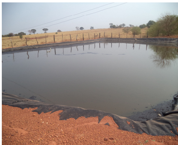
Foto 05. Lagoa de retenção de dejetos