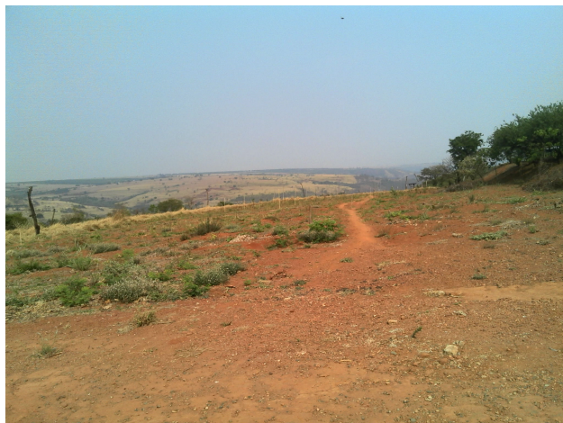
Foto 01. Área destinada à ampliação da suinocultura