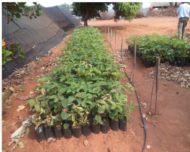
Foto 06. Viveiro para produção de mudas