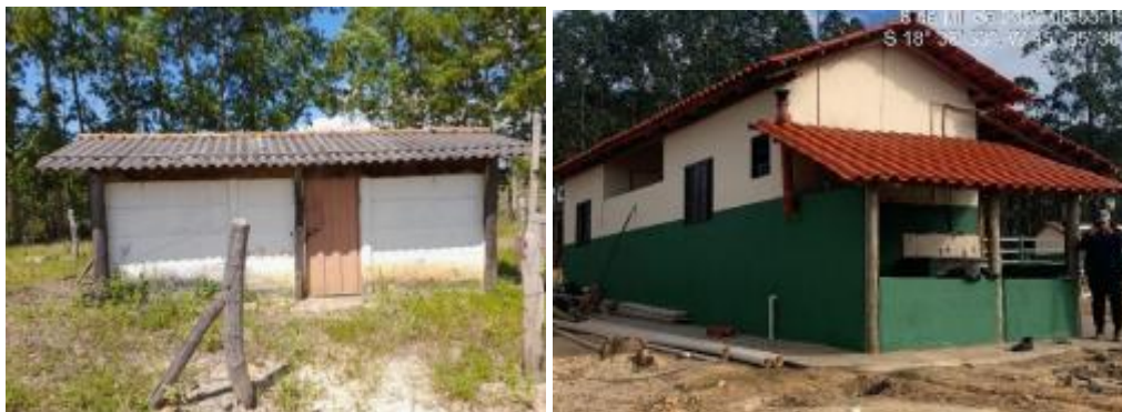
Figura 5. Depósito de ferramentas (Esquerda) e Escritório (Direita).