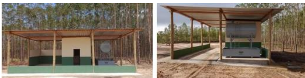
Figura 7. Depósito de óleos combustíveis e lubrificantes