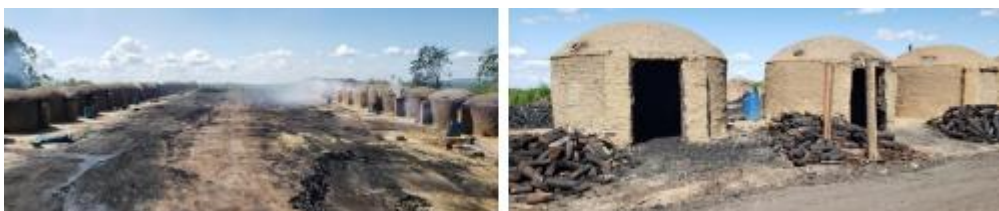
Figura 8. Conjunto de fornos para queima de carvão