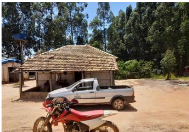
Figura 4. Casas de colaboradores.