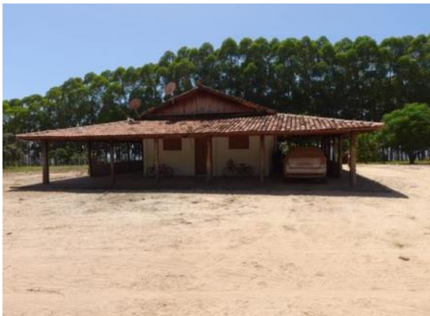
Figura 3. Casa Sede