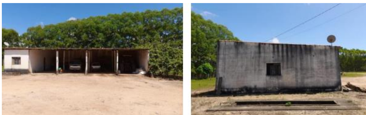
Figura 2. Galpão e Almoxarifado