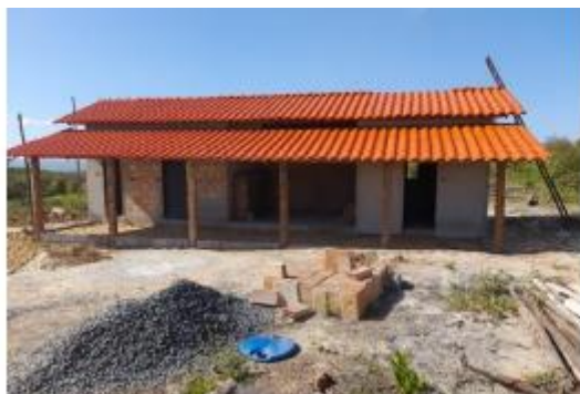
Figura 4. Alojamento da Unidade de Produção de Carvão