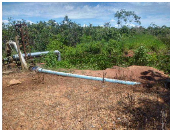
Foto 04. Tubulação e bomba para captação de água no Rio Paranaíba