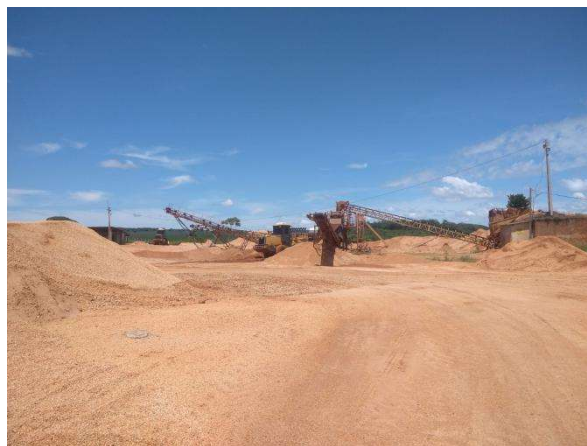
Foto 02. Paiol para classificação e armazenamento da areia