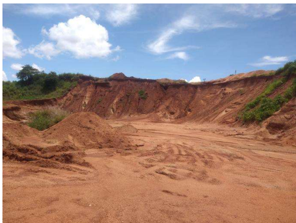
Foto 01. Cava de extração