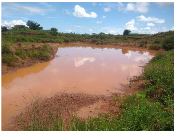
Foto 03. Bacia de decantação