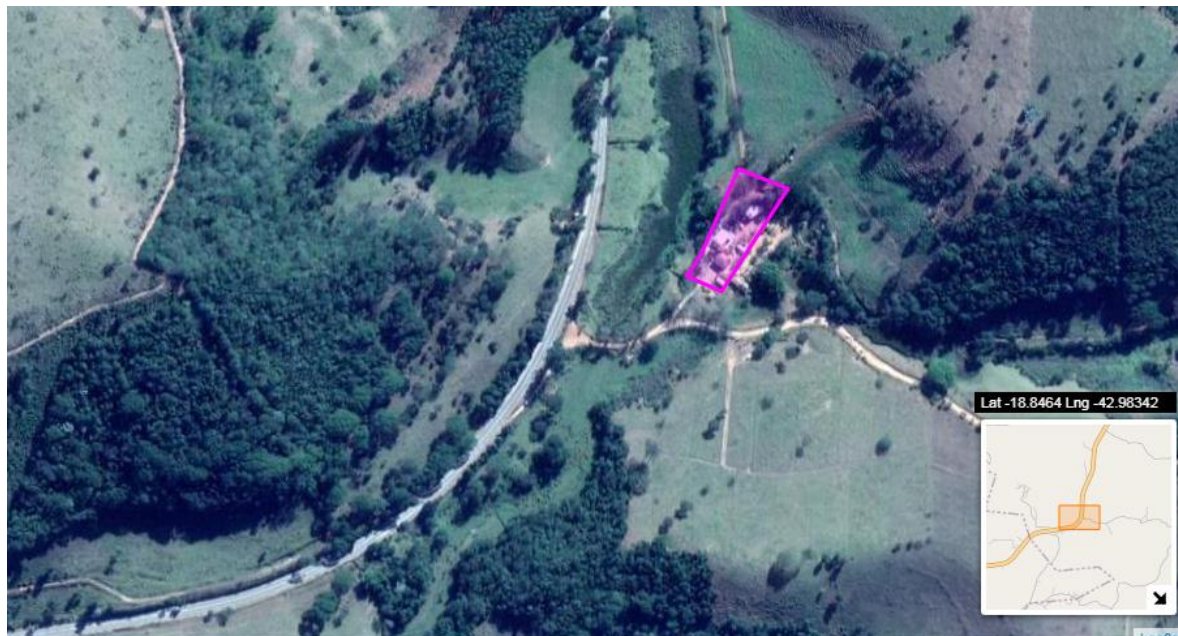
Figura 02: Localização georreferenciada do empreendimento LATICINIOS ELIAS PEREIRA LTDA

de Pesquisa e Conservação de Cavernas (CECAV) e disponíveis no IDE estando situado em área de potencialidade baixa para ocorrência de cavidades.