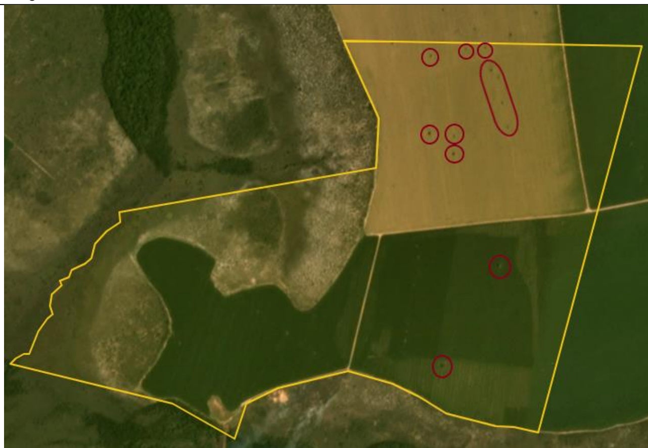
Figura 2. Presença de árvores isoladas. Fonte: Plataforma SCCON, data da imagem Janeiro/2018