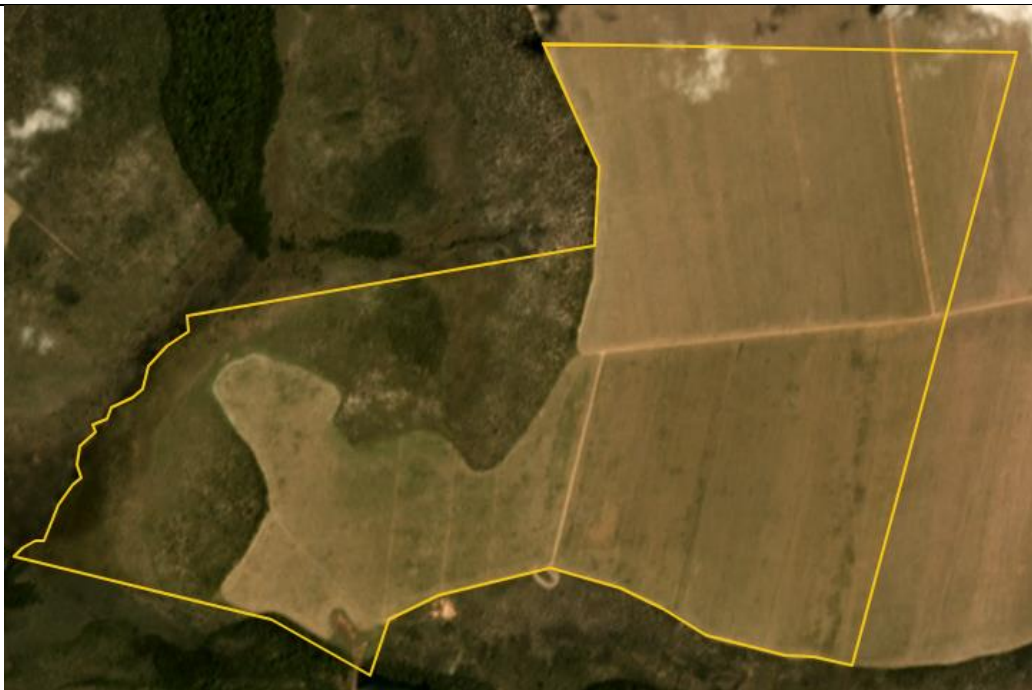
Figura 3. Ausência das árvores isoladas. data da imagem Dezembro/2018