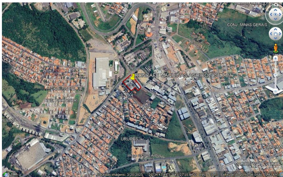
FIGURA 01 - Imagem de satélite da RONCAFE MAQUINAS AGRICOLAS LTDA.

A propriedade onde a RONCAFE está inserida possui área total do terreno de 8.922,81 m 2 e uma área útil/área construída de 4.711,24 m 2 , sendo construídos de: 3.822,00 m 2 de pavimento térreo, 160,74 m 2 de pavimento inferior, 690,70 m 2 de pavimento superior e 37,80 m 2 referentes ao terraço, conforme declarado no Relatório de Controle Ambiental - RCA.