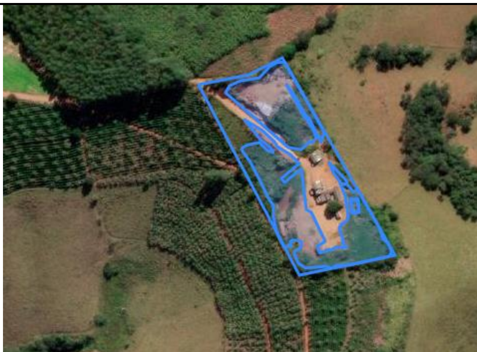
Figura 01. Entorno do empreendimento e poligonal das áreas degradadas.