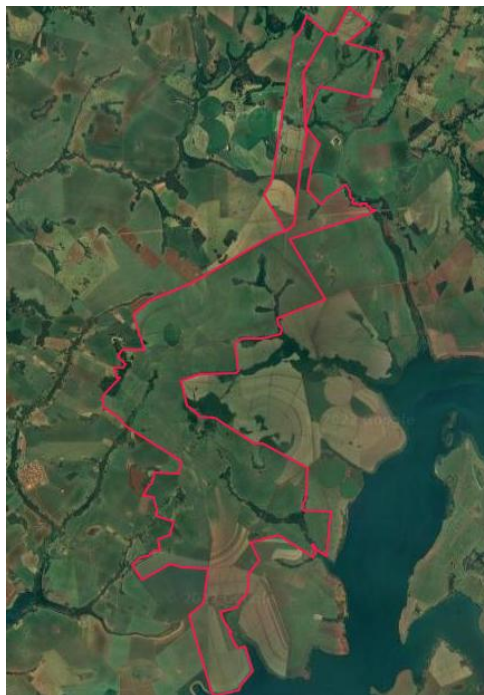
Figura 1. Delimitação da área do empreendimento (em vermelho).

De Uberaba/MG, no entroncamento da BR 050 com a MG 427, percorrer 3,95 km pela MG 427, virar à esquerda (via de acesso, antiga estrada para Água Comprida/MG), percorrer nessa estrada mais 16,66 km, divisa-se com solos do empreendimento DASANAS, nas Coordenadas Geográfica: 19° 57' 27.180" S 48° 1' 27.840" W