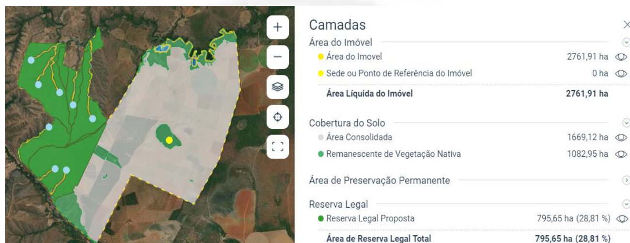
Quadro-2. Quadro de uso e ocupação do solo.