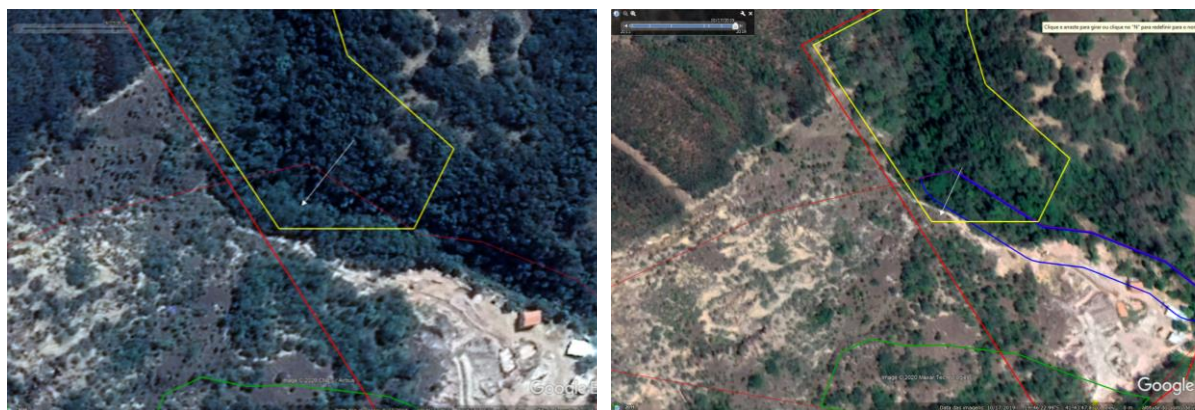
Figura 3. Localização da área antes do desmatamento (imagem de 27/09/2018) e após o desmatamento (imagem de 17/10/2019).

Por fim, aparentemente, o empreendimento ultrapassou os limites da própria poligonal, sem apresentar anuência da Agência Nacional de Mineração (Figura 4).