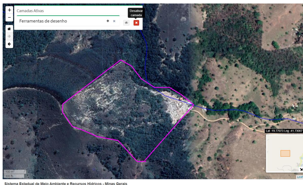
Figura 1. Localização do empreendimento Hélio Bernardino Rodrigues.