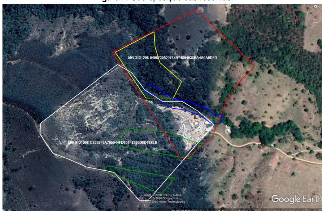
Figura 2. Sobreposição das reservas.