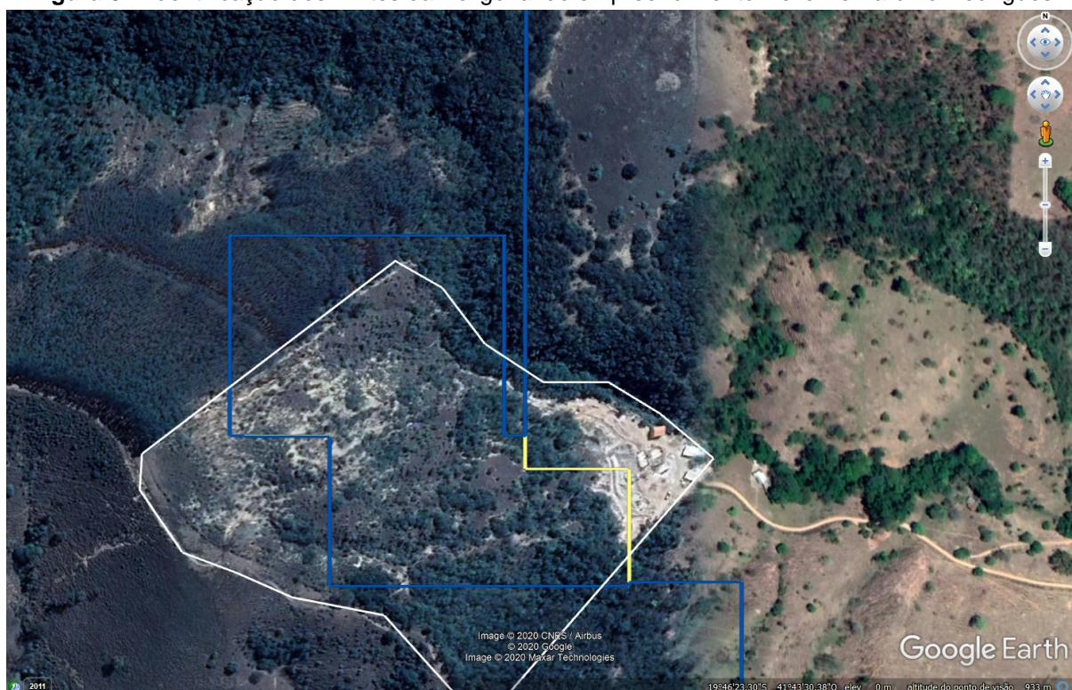
Figura 04. Identificação dos limites da Poligonal do empreendimento Helio Bernardino Rodrigues.