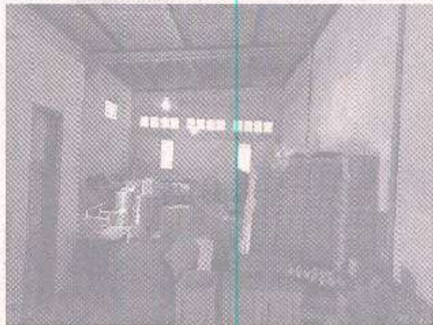
Foto 02. Visão interna da empresa