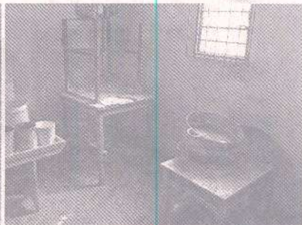
Foto 04. Área de produção