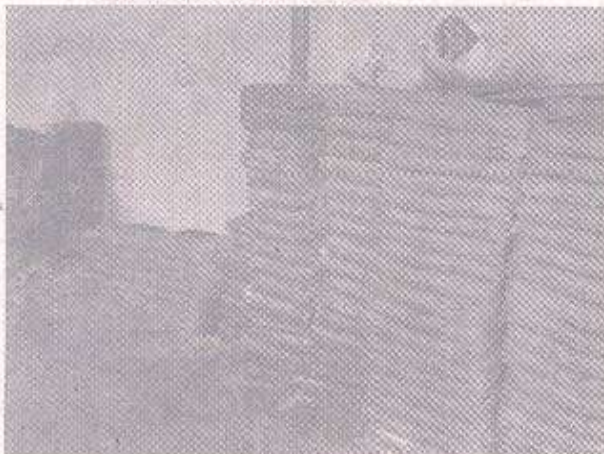
Foto 03. Armazenamento de insumos