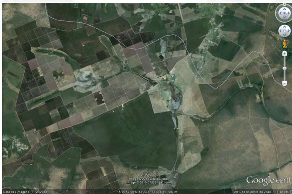
Figura 2 – Imagem Google Earth ilustrando APP e talhões de eucalipto.