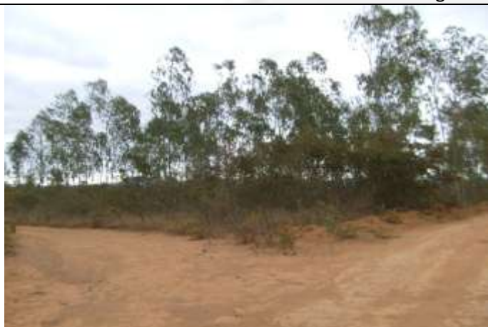
Foto 5 – Estradas e indivíduos de eucalipto na área de Reserva Legal.