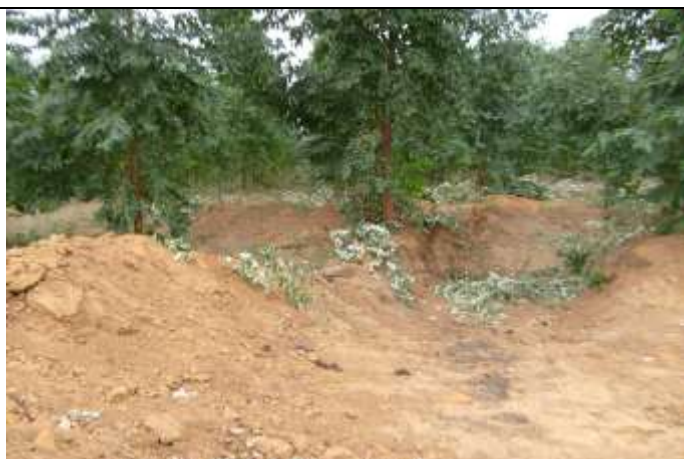
Foto 9 – Camalhões e bacias de contenção nas estradas no interior dos plantios.