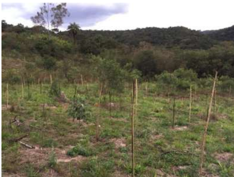
Figura 3 Plantio das mudas