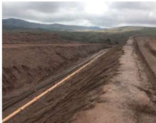
Figura 9 Controle de Drenagem