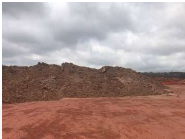
Figura 16 Estéril da UTM depositado na Pilha do Sapecado