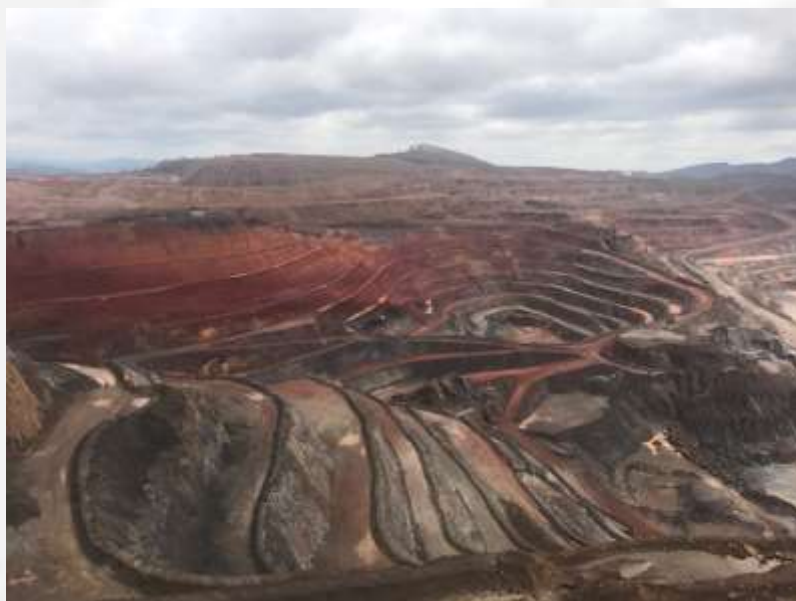
Figura 17 Mina do empreendimento