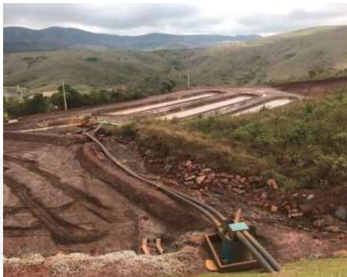
Figura 5 Baías de retomada d'água em operação