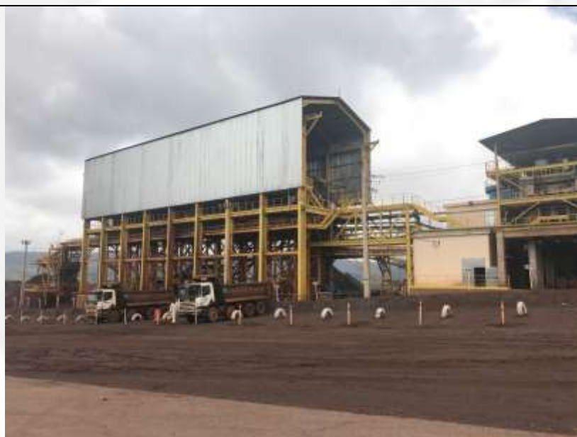
Figura 14 Estrutura de 24 metros de altura implantada para armazenamento dos filtros cerâmicos