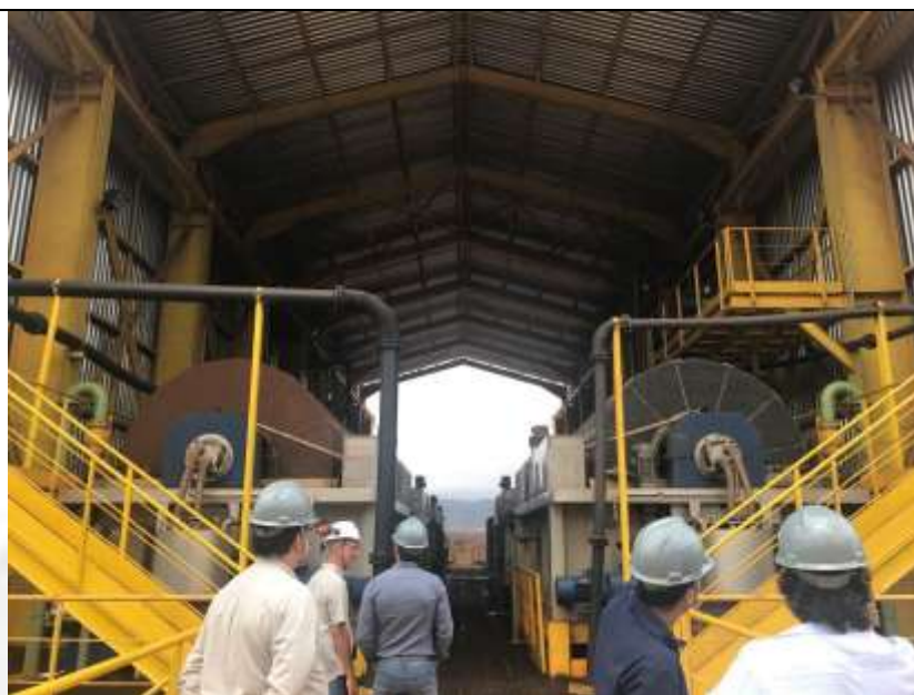
Figura 13 Filtros cerâmicos de secagem em operação no empreendimento