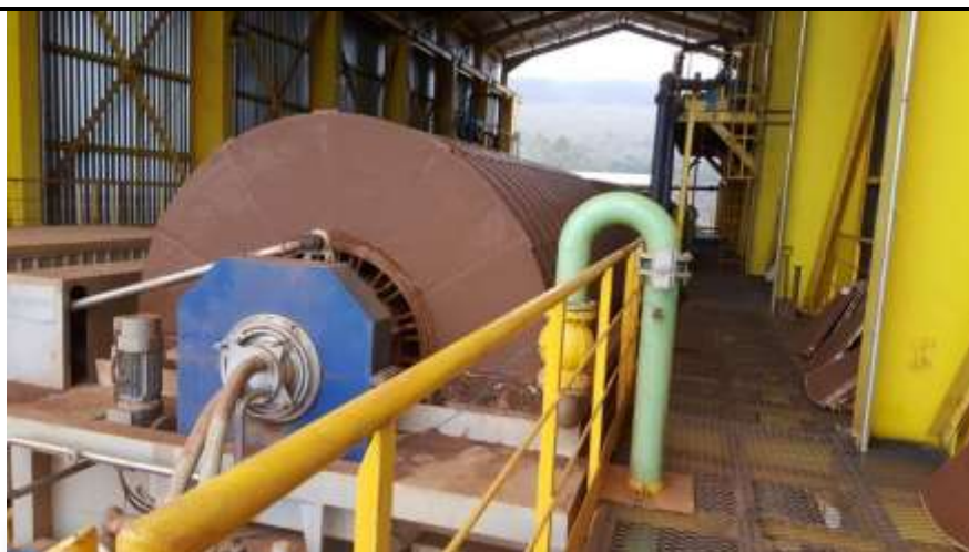
Figura 15 Filtro cerâmico para secagem do rejeito em operação no empreendimento

Conforme previsto, todo o rejeito/estéril do empreendimento está sendo disposto na Pilha de Estéril do Sapecado do empreendimento mineral vizinho ao empreendimento. No âmbito da LIC foi apresentada documentação permitindo o depósito, considerando que o empreendimento não possui autorização ambiental para dispor de estéril na Pilha Tanque Seco e tampouco nas Barragens B1 e B4.