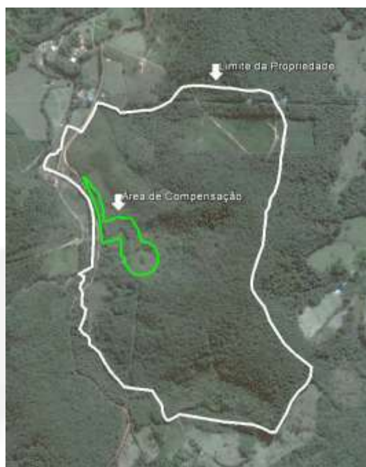
Figura 1 Área objeto do TCA