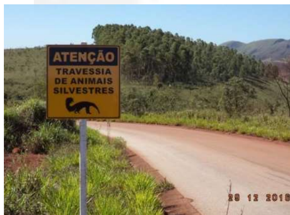
Figura 10 Placas indicando a travessia de animais silvestres na estrada que liga a mina à usina da Mineração Herculano LTDA

Abaixo são apresentadas algumas fotografias apresentadas no relatório de cumprimento da condicionante nº 18.