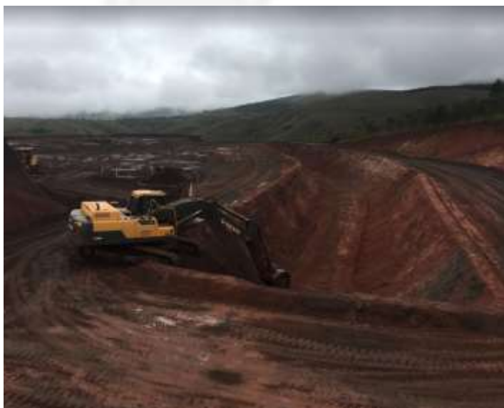
Figura 6 Baía de sedimentação em terreno natural em implantação