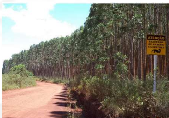
Figura 11 Placas indicando a travessia de animais silvestres na estrada que liga a mina à usina da Mineração Herculano LTDA