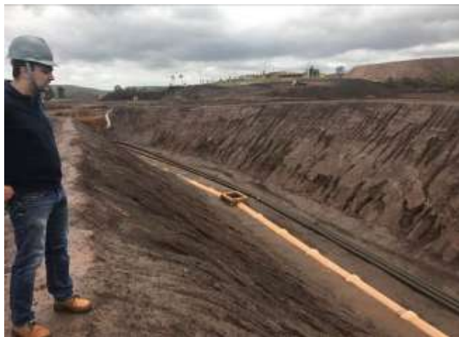
Figura 8 Sistema de controle de drenagem para isolar a Barragem B 1