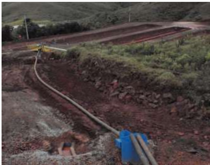
Figura 4 Baías de recuperação d'água em construção