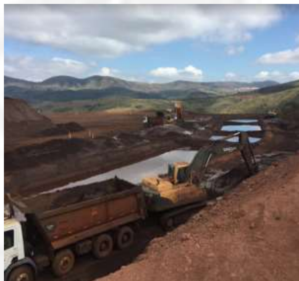
Figura 7 Baías de decantação em operação