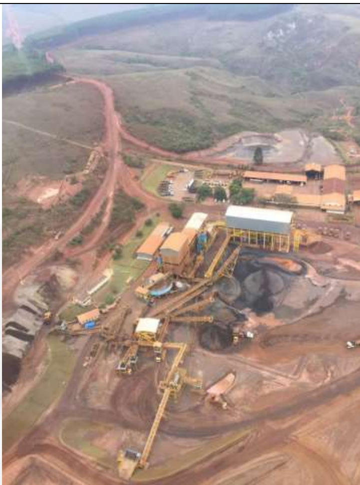
Figura 12 UTM do complexo minerário da Herculano Mineração