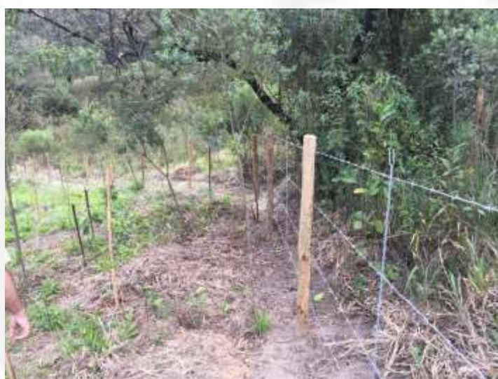
Figura 2 Cercamento da área.