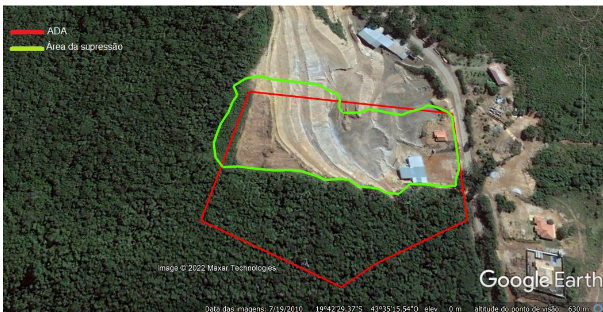
Imagem 06: Área do empreendimento em 19/07/2010, depois da supressão.