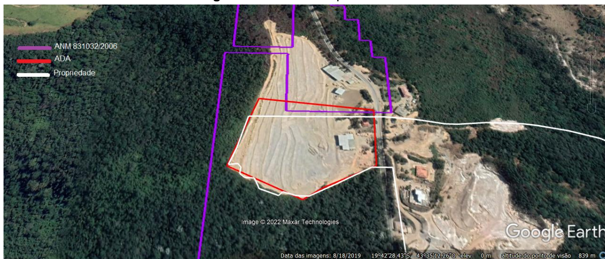
Imagem 01: Área do empreendimento.