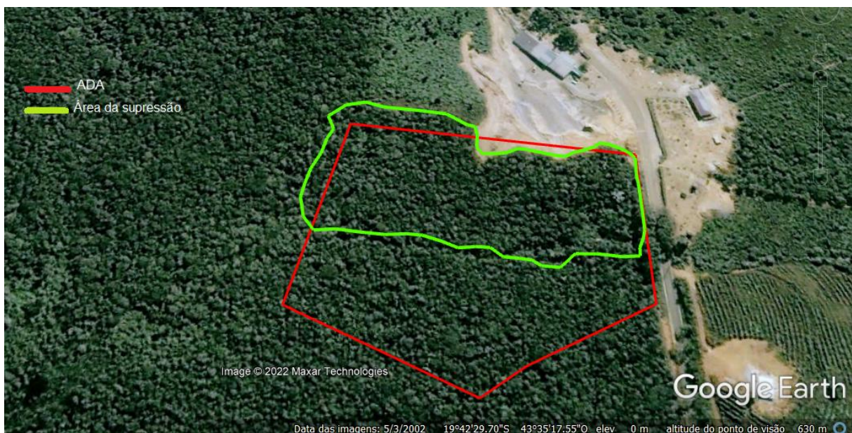
Imagem 05: Área do empreendimento em 03/05/2002, antes da supressão.