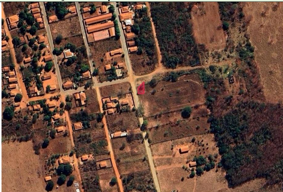
Imagem 01 - Localização do empreendimento

O empreendimento “POSTO IRMÃOS NASCIMENTO”, inscrito no CNPJ sob o nº.: 59.545.263/0001-29. O empreendimento localiza-se em zona urbana, situado a Rua do Campo, S/N - do município de Icaraí de Minas, cujas coordenadas geográficas de ponto central correspondem a latitude 16° 13,49” S e longitude 44° 57’ 38,79” O (SIRGAS 2000), imagem 01 abaixo.