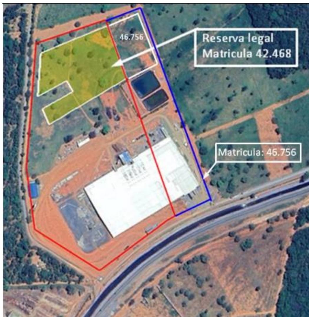
Imagem 5: Localização da área do plantio das mudas de pequi ( Caryocar brasiliense ), como compensação pela supressão de árvores dessa espécie.