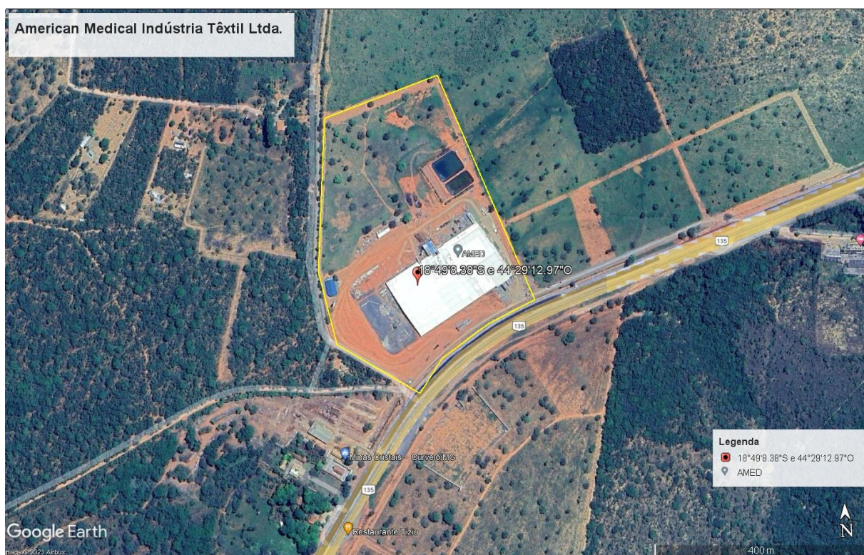
Imagem 1: Localização do Empreendimento