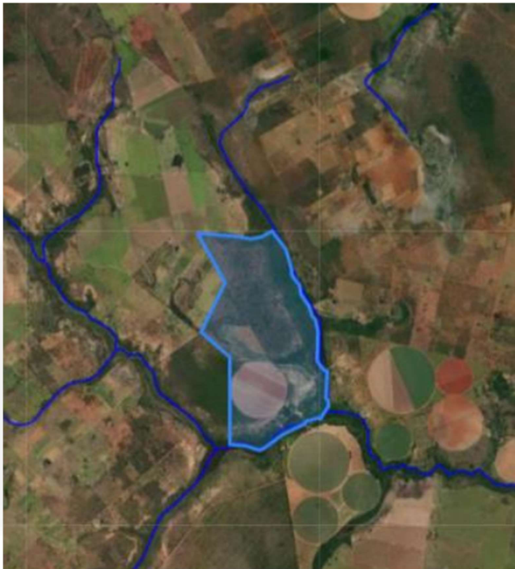
Figura 1 - Cursos d'água existentes no empreendimento, fonte IDE Sisema.

do empreendimento, o que pode ser confirmado por meio de imagens geoespaciais disponíveis no sítio eletrônico do IDE Sisema, conforme Figura 1;