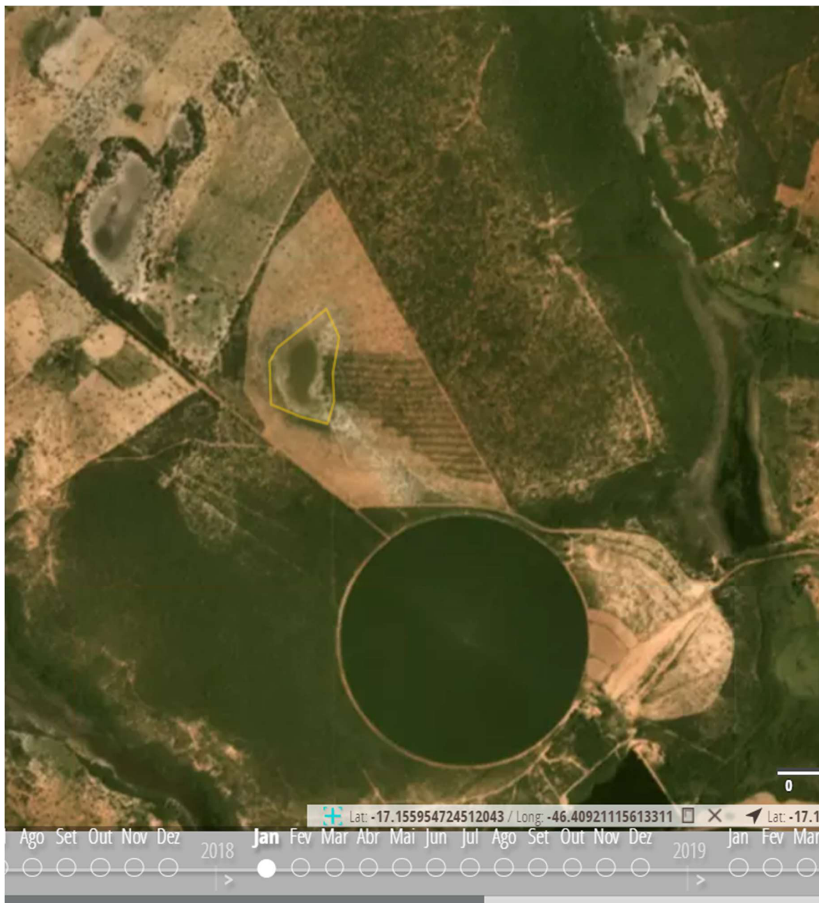
Figura 1 – Área no período de chuva, mês de janeiro de 2018, observa-se acúmulo de água.

Podemos concluir que a referida área objeto do PRAD não se caracteriza como lagoa natural intermitente, mas sim como uma área onde há acúmulo de água das chuvas, devido suas características físicas e estruturais dificultarem a percolação da água no perfil do solo, conforme demonstrado nas figuras 1 e 2.