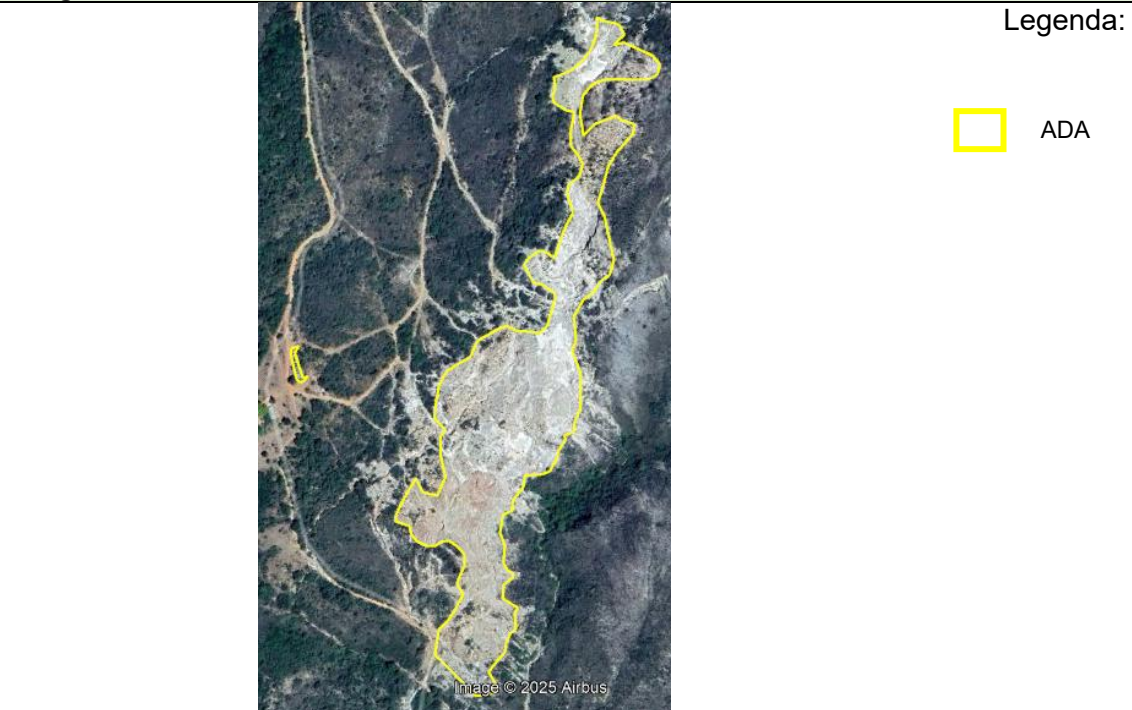
Imagem 01 – Localização do empreendimento

De acordo com o RAS (Relatório Ambiental Simplificado), o bioma que se encontra o empreendimento é o Cerrado, “ na ADA a vegetação já foi suprimida ”. O empreendimento não está localizado em área com remanescente de formações vegetais nativas, não tem presença de curso d’água e não se localiza em áreas cársticas. Foi informado que há área degradada no empreendimento que esta corresponde a 7,3483 ha.