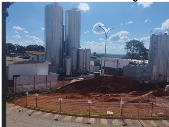
Foto 01. Vista da instalação da planta de ampliação da Nestlé.