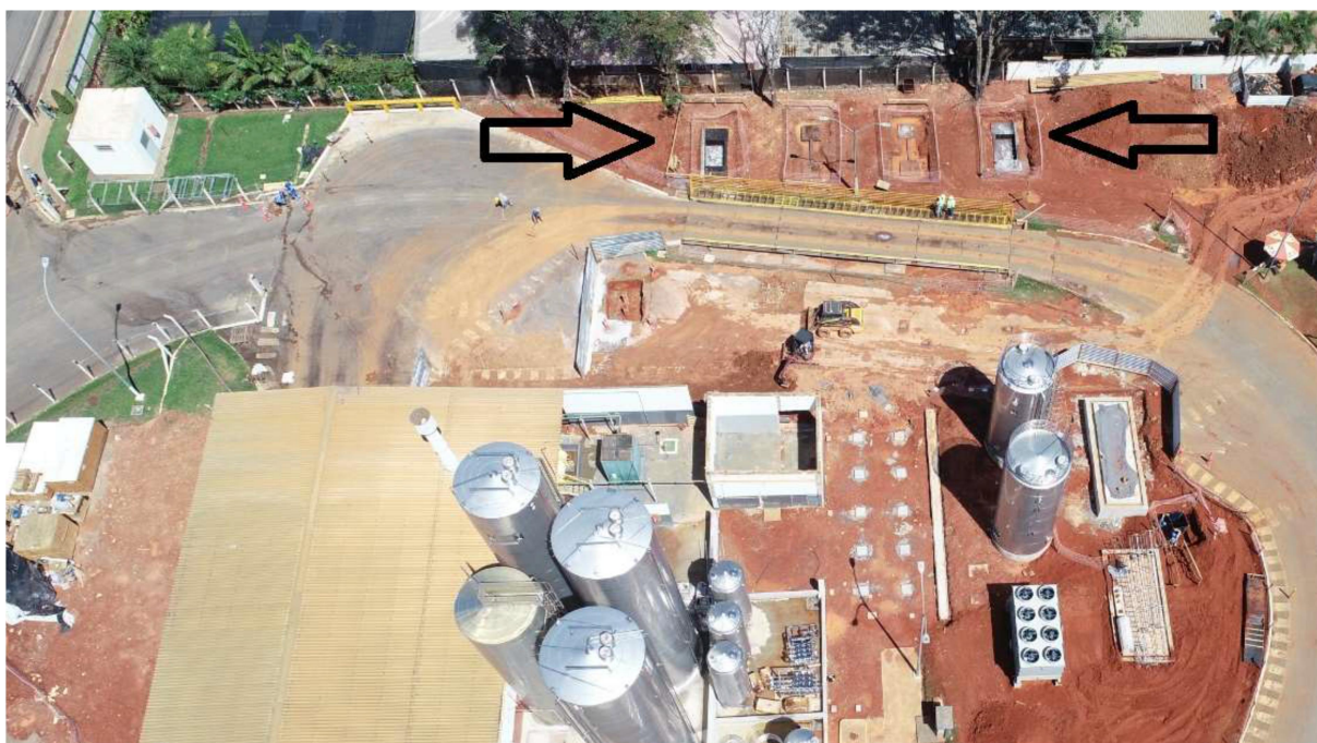
Figura 4- Imagem aérea de 19/11/2025 evidenciando a instalação de diversos equipamentos e estruturas da implantação do empreendimento Nestlé. Obs: Nas setas contidas na imagem encontra-se a fundação para instalação da nova balança.

Conforme relatado no RAS e verificado em vistoria as intervenções vinculadas ao projeto de ampliação da unidade industrial da Nestlé em Patos de Minas tiveram início no mês de maio, com demolição da casa de apoio, obras de terraplanagem e preparação de bacias de contenção para os novos equipamentos e estruturas. As obras tiveram seu reinício no mês de outubro de 2025, dando prosseguimento às intervenções previstas no projeto de ampliação, como a instalação de tanques diversos, perfuração de solo para instalação de equipamentos e estruturas diversas.