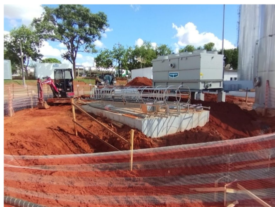
Foto 03. Obras de Instalação de equipamentos para ampliação.