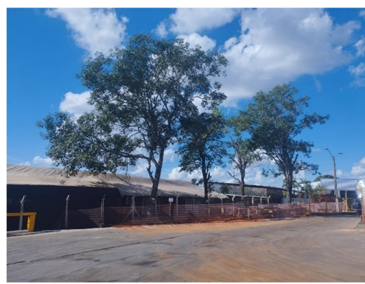
Foto 04. Ipês que serão suprimidos