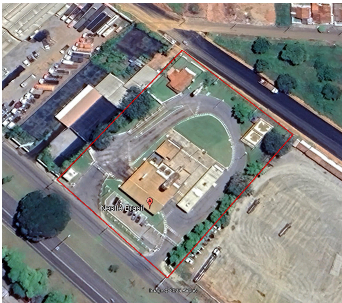
Figura1- Localização do empreendimento NESTLE BRASIL LTDA.

O objeto do presente processo compreende a ampliação, considerando implantação corretiva e operação do empreendimento NESTLE BRASIL LTDA, que atua no resfriamento e distribuição de leite, localizado na Avenida Juscelino Kubitschek, nº1999, Patos de Minas-MG. A área total da indústria possui aproximadamente 6.789m 2 (Figura 1).