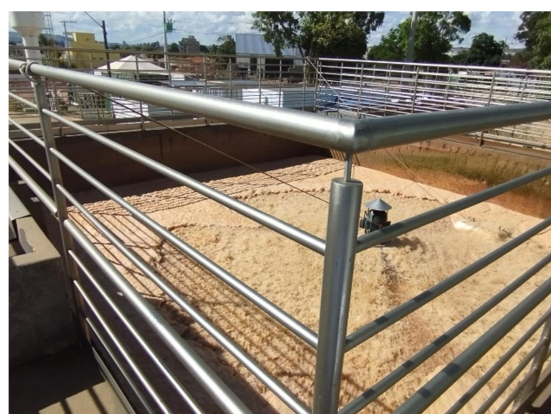
Foto 03. Vista da Estação de Tratamento de Efluentes.