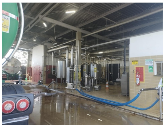
Foto 04. Área de descarga de leite para resfriamento em operação.