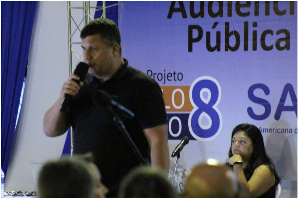
Fruta de Leite – 11/05/2022