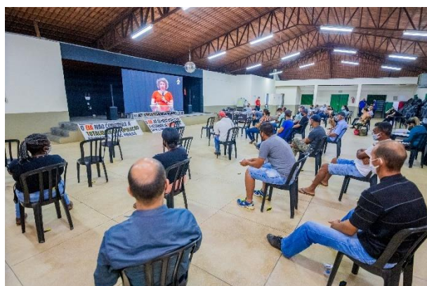
Figura 4 - Espaço presencial para comunidade em Rio Doce