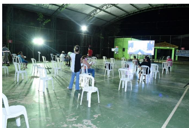
Figura 6 - Espaço presencial para comunidade de Ponte Nova (Xopotó e Pontal) em Santa Cruz do Escalvado - Quadra de Novo Soberbo