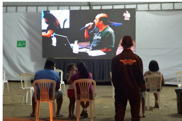
Figura 10 - Ponto de Transmissão em Rio Doce - Tenda em Santana do Deserto