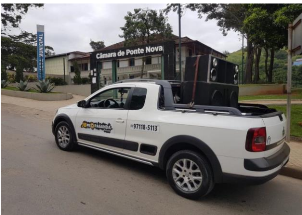
Figura 17 - Divulgação da Audiência nas Comunidades (Carro de Som)