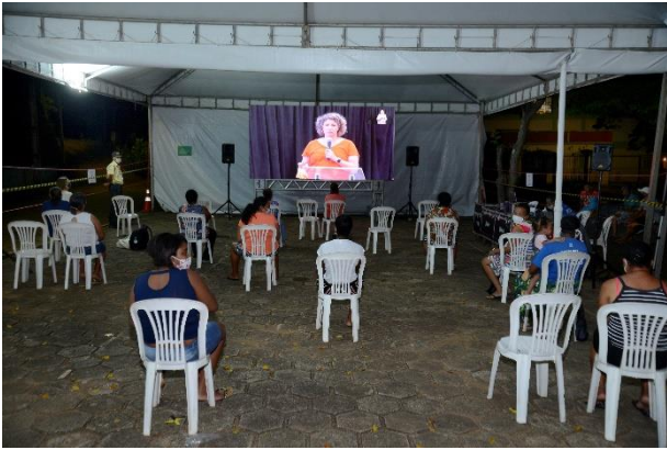
Figura 7 - Ponto de Transmissão em Santa Cruz do Escalvado - Tenda em Merengo