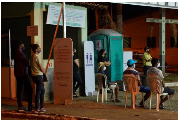
Figura 9 - Ponto de Transmissão em Santa Cruz do Escalvado - Tenda em Merengo (Estrutura de Segurança e Saúde)