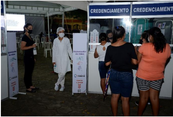
Figura 13 - Ponto de Transmissão em Rio Doce – Tenda em Santana do Deserto (Credenciamento)