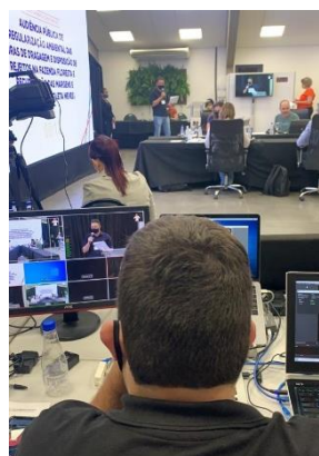
Figura 2 - Transmissão em tempo real da Audiência Pública