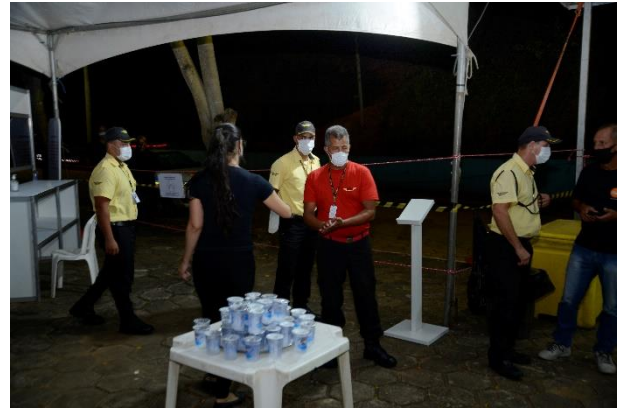
Figura 14 - Ponto de Transmissão em Rio Doce – Tenda em Santana do Deserto (Distribuição de Água)