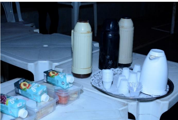
Figura 15 - Kits de Alimentação fornecidos para as comunidades