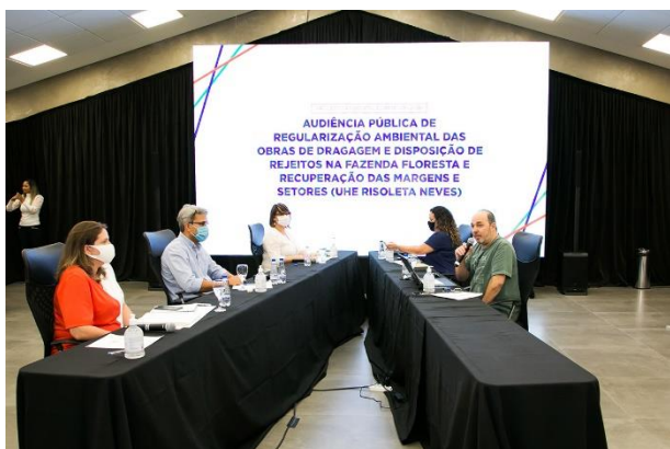
Figura 1 - Apresentação da Audiência em Belo Horizonte