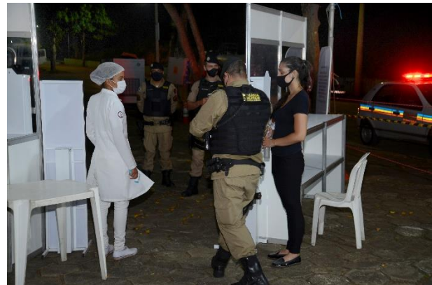
Figura 12 - Ponto de Transmissão em Rio Doce - Tenda em Santana do Deserto (Estrutura de Segurança e Saúde)