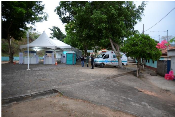
Figura 11 - Ponto de Transmissão em Rio Doce - Tenda em Santana do Deserto (Estrutura Geral)