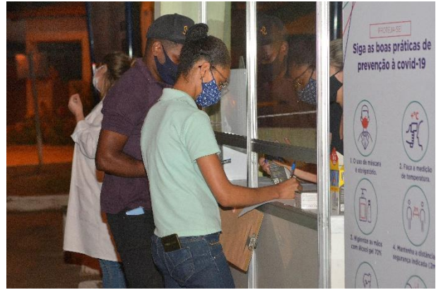
Figura 8 - Ponto de Transmissão em Santa Cruz do Escalvado - Tenda em Merengo (Credenciamento)