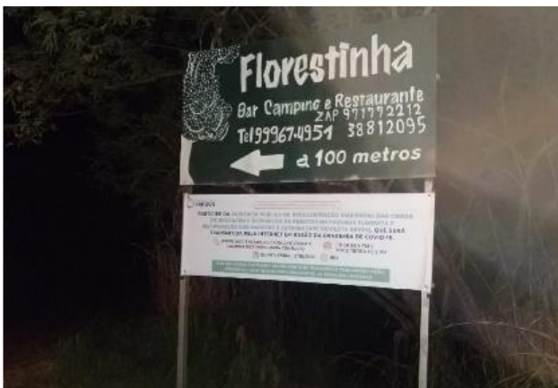
Figura 18 - Divulgação da Audiência nas Comunidades (Faixas)