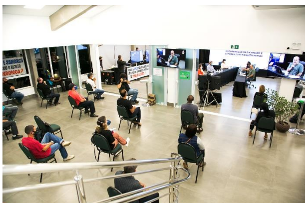
Figura 3 - Espaço presencial para comunidade em Belo Horizonte