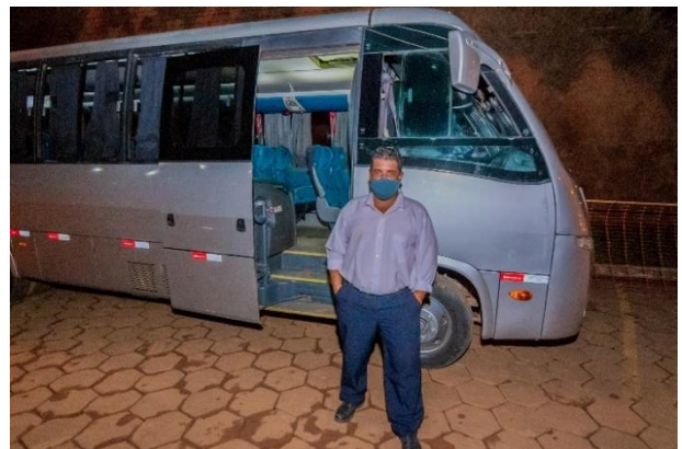
Figura 16 - Transporte fornecidos para as comunidades