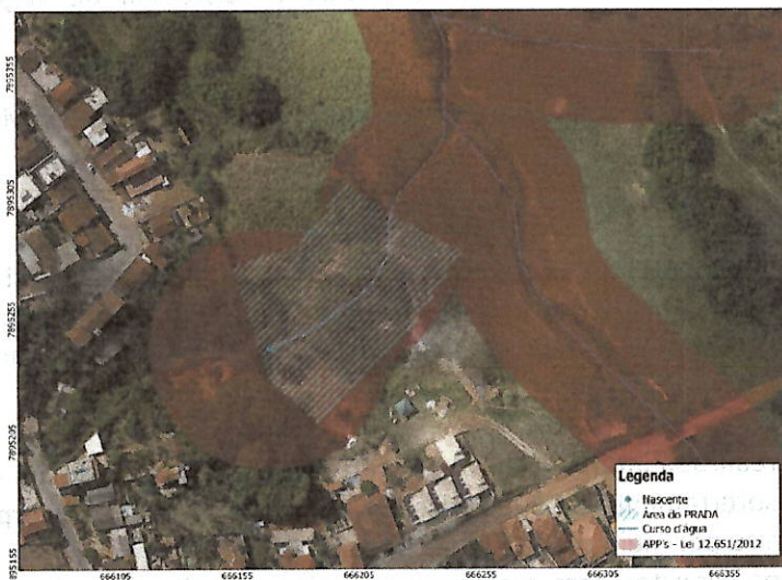
Figura 1: Mapa de localização da área escolhida para compensação.

Será implantado PRADA na modalidade recuperação , em Áreas de Preservação Permanentes - APP que possuem uso alternativo do solo que totalizam 0,48925 ha, no imóvel particular de Enéas Pires pena, entre as coordenadas UTM|SIRGAS2000|23K 1 – X: 666158.56 / Y: 7895256.36 e 2 – X: 666207.18 / Y: 7895296.14 (Figura 1).