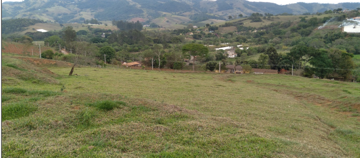
FIGURA 02: Panorâmica do imóvel Sítio Três Irmãos - Gleba A e B, bairro da Lagoa, município de Estiva/MG.