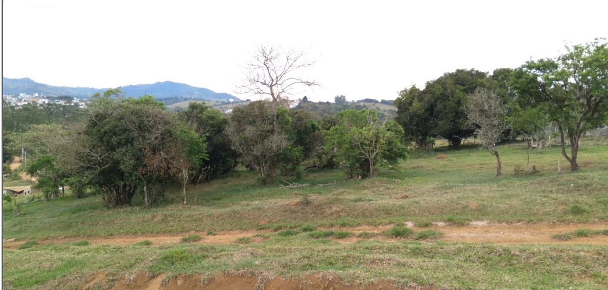
FIGURA 06: Local da intervenção ambiental, com corte e aproveitamento de árvores isoladas nativas vivas, presente na área do empreendimento Loteamento Nova Estiva, bairro da Lagoa, município de Estiva/MG.

É requerida autorização para Intervenção Ambiental em uma área total de 15,82,82 ha, através da corte ou aproveitamento de 384 (trezentos e oitenta e quatro) árvores isoladas nativas vivas, coordenadas geográficas (UTM) 395.360 E / 7.513.869 S (Datum: SIRGAS 2000/Fuso: 23 K), com a finalidade de implantação de empreendimento condomínio residencial Loteamento Nova Estiva, através da construção de edificações, vias de acesso, sistema de drenagem, sistema elétrico, conforme demarcação em levantamento planialtimétrico apresentado.