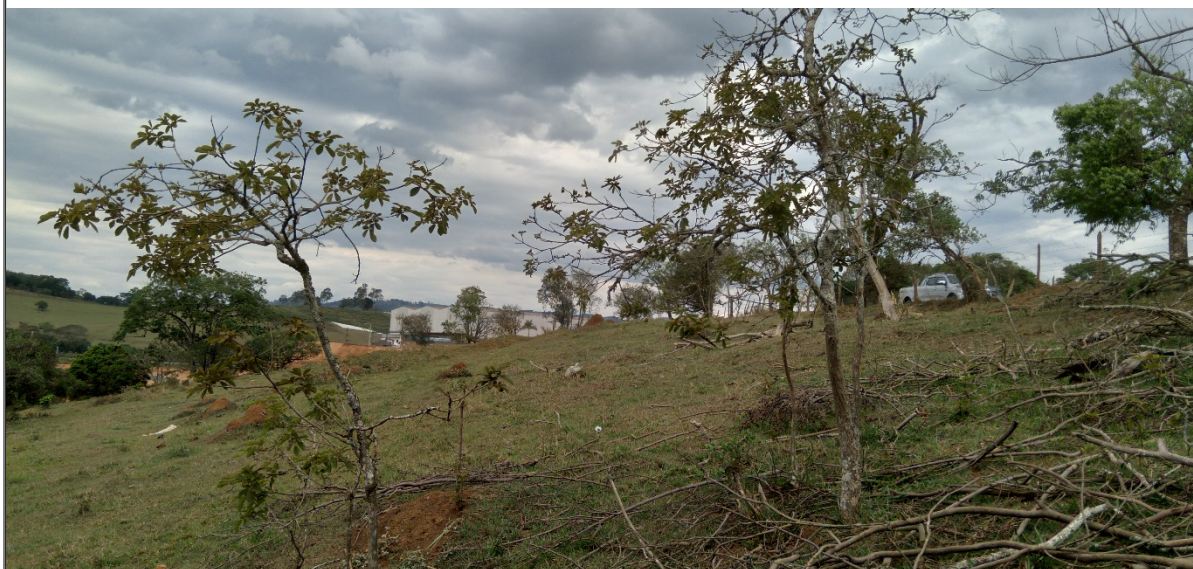
FIGURA 12: Imagem das espécies Handroanthus alba (Ipê amarelo) presentes na área do empreendimento Loteamento Nova Estiva, bairro da Lagoa, município de Estiva/MG, solicitada para supressão.

O material lenhoso oriundo da supressão de cobertura vegetal nativa, lenha e madeira de árvores isoladas serão armazenados na área do empreendimento, não podendo ser comercializados.