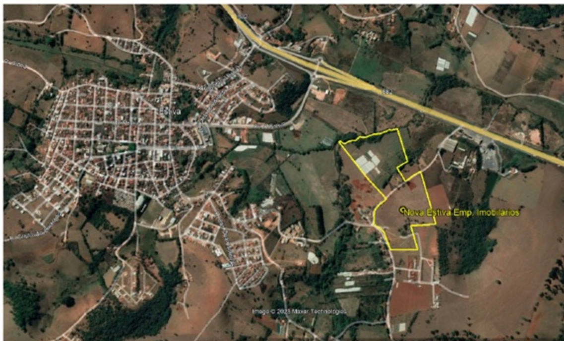
FIGURA 14: Imagem do imóvel Sítio Três Irmãos - Gleba A e B (linha amarela clara), com a área do empreendimento Loteamento Nova Estiva próximo à Rodovia Fernão Dias - BR 381 (linha amarela escura) (Imagem Google Earth 2023).

A vegetação é composta por fragmentos recobertos por Mata, por árvores nativas isoladas e por gramínea exótica (Braquiária). Conforme observado em campo o imóvel se encontra em região fortemente antropizada, em região de franca expansão urbana, nas proximidades da rodovia Fernão Dias (BR 381).