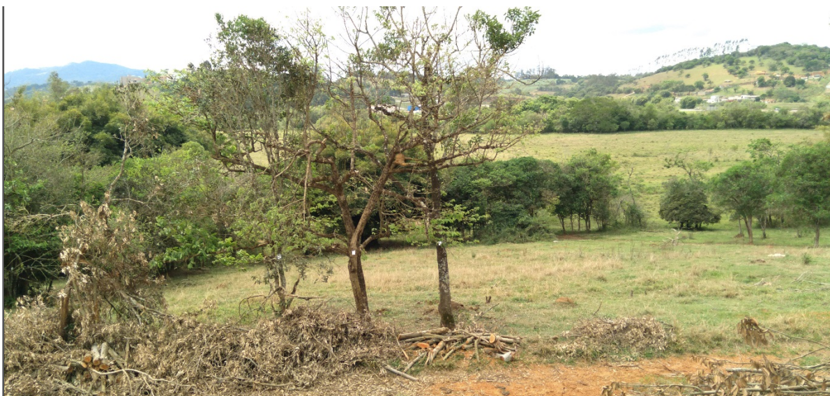
FIGURA 07: Local da intervenção ambiental, com corte e aproveitamento de árvores isoladas nativas vivas, presente na área do empreendimento Loteamento Nova Estiva, bairro da Lagoa, município de Estiva/MG.

O rendimento lenhoso foi estimado em 64,22 m 3 de lenha de floresta nativa e em 10,86 m 3 de madeira de floresta nativa (toras e toretes) oriundas do corte de 384 árvores isoladas nativas vivas, em uma área total de 15,82,82 ha, que foi inventariada por um inventário florestal através do método censo, sendo mensurados todos os indivíduos arbóreos com circunferência à altura do peito (CAP) maior ou igual a 15,7 cm, de responsabilidade técnica do Engenheiro Florestal Marlúcio Carvalho Milagres, CREA-MG nº. 70375/D, ART Obra / Serviço nº. MG20232160719.