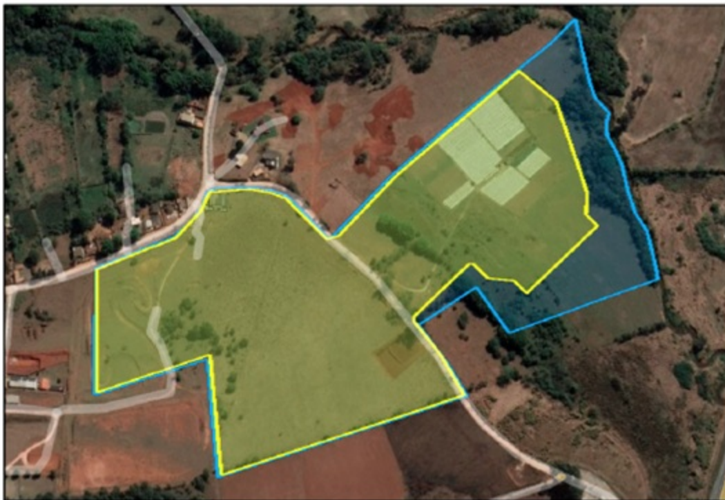
FIGURA 01: Imagem do imóvel Sítio Três Irmãos - Gleba A e B (linha azul), com a área do empreendimento Loteamento Nova Estiva (linha amarela), contempladas no presente parecer.