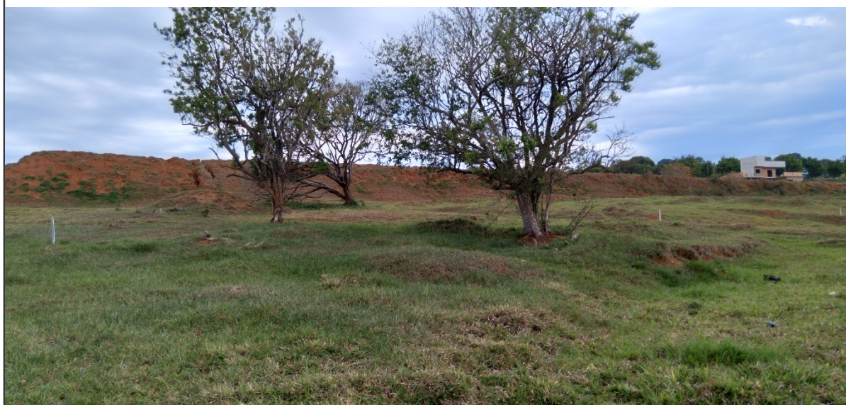
FIGURA 10: Imagem das árvores isoladas presentes na área de implantação do empreendimento Loteamento Nova Estiva, bairro da Lagoa, município de Estiva/MG.

No levantamento arbóreo das árvores isoladas realizado, foram mensurados 384 indivíduos, pertencentes a 27 espécies diferentes e 18 famílias botânicas diferentes, sendo quantificado entre elas uma espécie considerada ameaçada de extinção de acordo com a Portaria nº. 443 de 17/12/2014 do Ministério de Meio Ambiente – MMA, Ocotea odorifera (Canela sassafrás) com 29 indivíduos arbóreas mensurados e uma espécie considerada imune de corte segundo a Lei Estadual nº. 20.308 de 27/07/2012, Handroanthus alba (Ipê amarelo) com 02 indivíduos arbóreas mensurados.