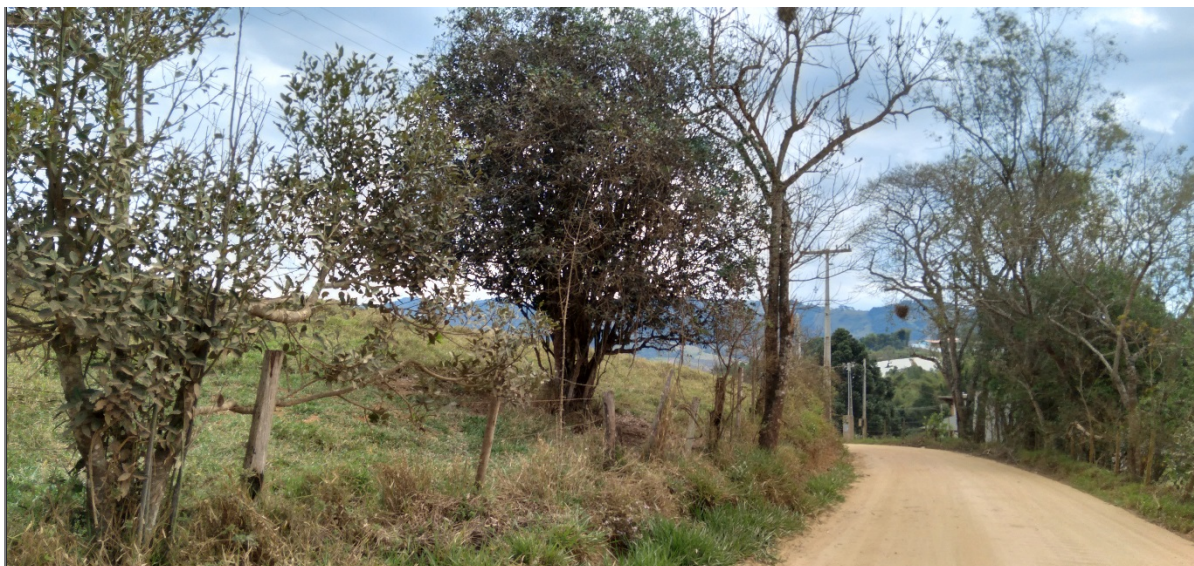
FIGURA 09: Imagem das árvores isoladas presentes na área de implantação do empreendimento Loteamento Nova Estiva, bairro da Lagoa, município de Estiva/MG.