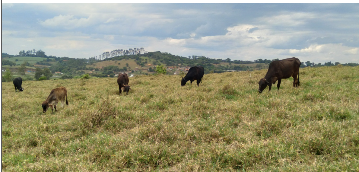
FIGURA 16: Imagem do imóvel Sítio Três Irmãos - Gleba A e B, bairro da Lagoa, município de Estiva/MG, com a presença de criação de gado.

As árvores solicitadas para corte e aproveitamento se encontram em meio a uma matriz de áreas de campo antrópico com extensas áreas de lavouras e pastagens para criação de gado, conforme pode ser verificado junto as imagens que detalham ilustrações do local.