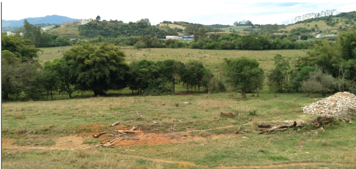
FIGURA 05: Panorâmica da área do empreendimento Loteamento Nova Estiva, bairro da Lagoa, município de Estiva/MG.