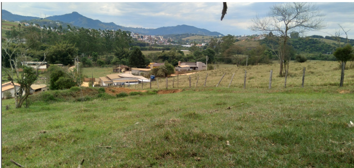
FIGURA 03: Panorâmica do imóvel Sítio Três Irmãos - Gleba A e B, bairro da Lagoa, situado em zona urbana do município de Estiva/MG.

O imóvel se encontra registrado junto ao Cartório do Registro de Imóveis da Comarca de Pouso Alegre/MG, sob matrícula nº. 120.861, livro nº. 2, folha 01 pertencente a NOVA ESTIVA EMPREENDIMENTOS IMOBILIÁRIOS LTDA. desde 10 de agosto de 2023.