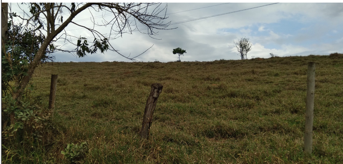
FIGURA 17: Imagem da área de implantação do PTRF (compensação ambiental) no empreendimento Loteamento Nova Estiva, bairro da Lagoa, município de Estiva/MG.

Foi apresentado Projeto Técnico de Reconstituição da Flora – PTRF em uma área situada dentro dos limites do imóvel, totalizando de 01,11,84 ha, sendo 00,48,44 ha em APP e 00,63,40 ha fora de APP, através do plantio total de 1.243 mudas de espécies nativas da região, sendo que no mínimo serão plantadas 580 mudas de Ocotea odorifera e 40 mudas de Handroanthus alba , no espaçamento 3,0 x 3,0 m, coordenadas geográficas (UTM) 395.674 E / 7.514.377 S e 395.858 E / 7.514.111 S (Datum SIRGAS 2000), bairro da Lagoa, município de Estiva/MG, conforme proposta descrita no PTRF, de responsabilidade do Engenheiro Florestal Marlúcio Carvalho Milagres, CREA-MG nº. 70375/D, ART Obra / Serviço nº. MG20232160719, anexado ao processo. O local está recoberto de vegetação exótica rasteira (Braquiária), não se encontra isolado por cerca de arame e há vestígios de animais domésticos de médio e grande porte pastando na área.