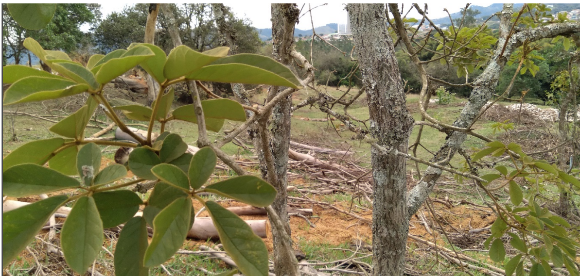
FIGURA 11: Imagem da espécie Handroanthus alba (Ipê amarelo) presente na área do empreendimento Loteamento Nova Estiva, bairro da Lagoa, município de Estiva/MG, solicitada para supressão.