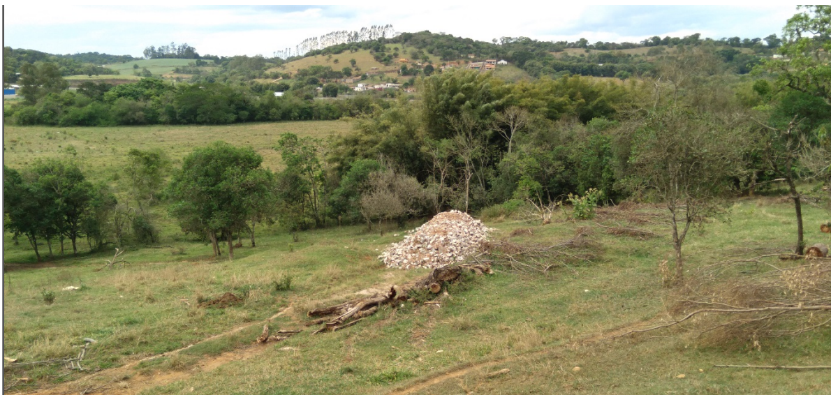
FIGURA 15: Imagem da área de preservação permanente – APP (ao fundo) do Ribeirão Três Irmãos, presente na área do empreendimento Loteamento Nova Estiva, bairro da Lagoa, município de Estiva/MG, que não ocorrerá intervenção ambiental.