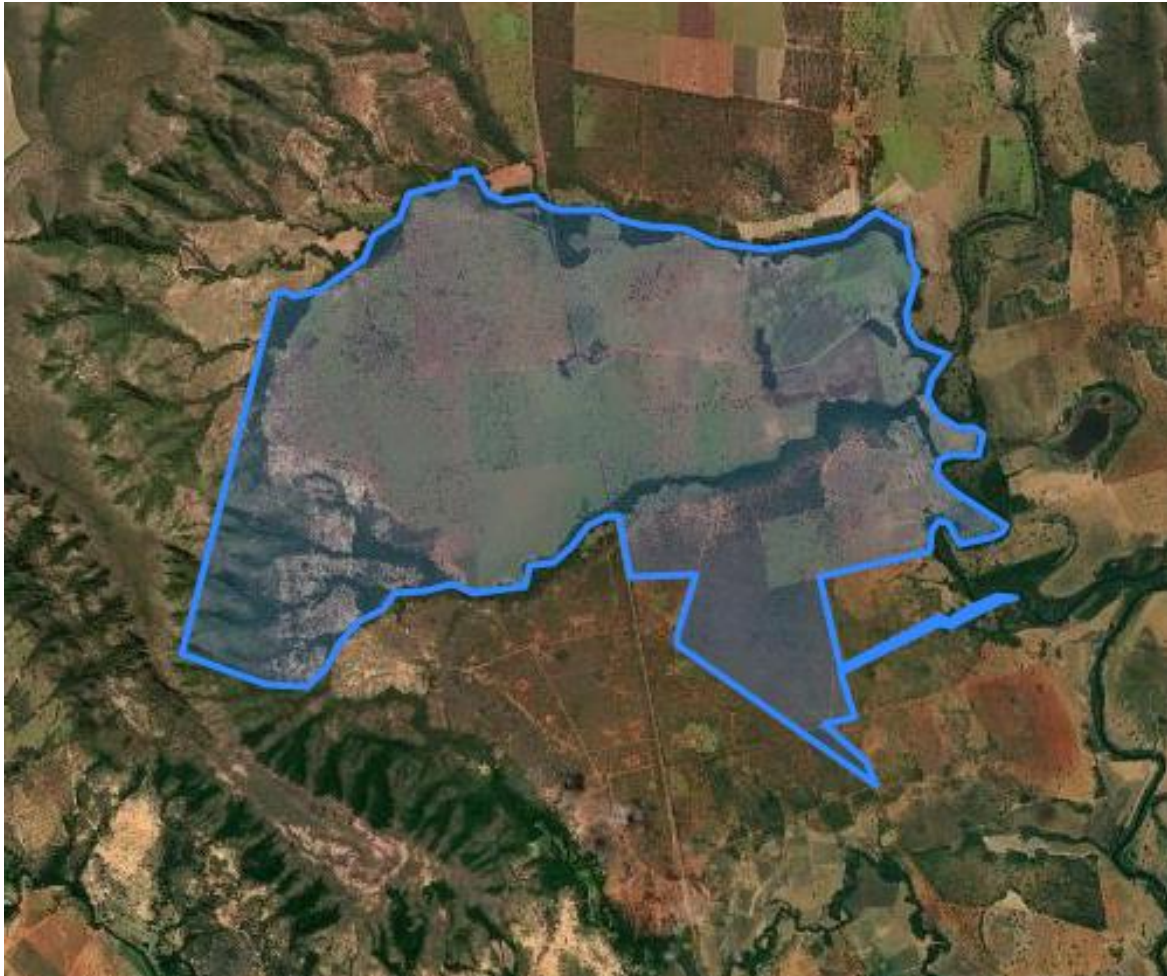
Imagem 01 – Localização do empreendimento.

A atividade contemplada neste processo, em operação no empreendimento, é culturas anuais, semiperenes e perenes, silvicultura e cultivos agrossilvipastoris, exceto horticultura (G-01-03-1), numa área plantada de 1.104,5630 ha. Opera ainda, a atividade de ponto de abastecimento de combustíveis (F-06-01-7), sendo não passível de licenciamento ambiental. Nos termos da Deliberação Normativa COPAM nº 217/2017, a atividade principal tem porte grande e o empreendimento enquadra-se na classe 4.