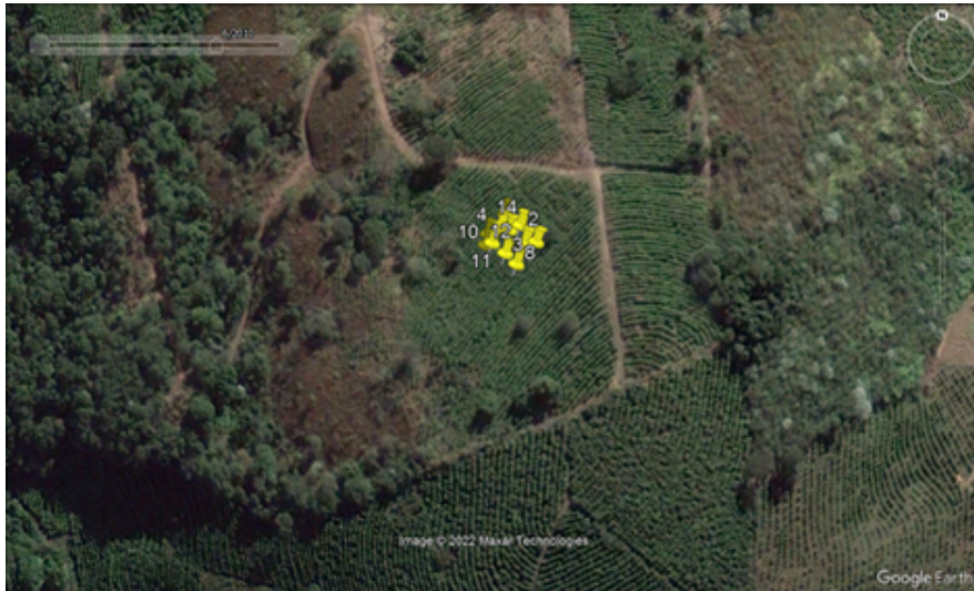
FIGURA 06: Imagem do local da intervenção ambiental e das árvores (marcadores em amarelo) solicitadas para corte ou aproveitamento na Fazenda Libertas, bairro Batinga, município de Monte Sião/MG, ano de 2010. Local com plantio de lavoura de café.

FIGURA 05: Imagem do local da intervenção ambiental e das árvores (marcadores em amarelo) solicitadas para corte ou aproveitamento na Fazenda Libertas, bairro Batinga, município de Monte Sião/MG, ano de 2018. Local com lavoura de café abandonada.