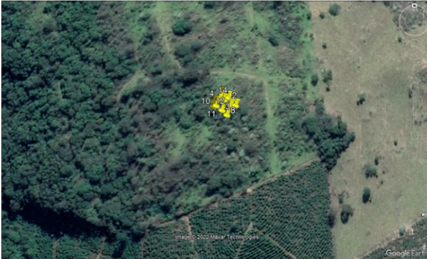
FIGURA 03: Imagem do local da intervenção ambiental e das árvores (marcadores em amarelo) solicitadas para corte ou aproveitamento na Fazenda Libertas, bairro Batinga, município de Monte Sião/MG, ano de 2022. Local recoberto por capoeira (cobertura vegetal nativa em estágio inicial de regeneração natural).

nativa em estágio inicial de regeneração natural, estando os indivíduos arbóreos conectados pelo estrato arbóreo formando uma capoeira.