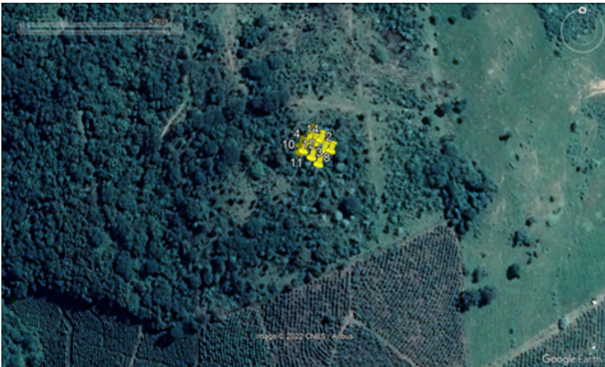
FIGURA 04: Imagem do local da intervenção ambiental e das árvores (marcadores em amarelo) solicitadas para corte ou aproveitamento na Fazenda Libertas, bairro Batinga, município de Monte Sião/MG, ano de 2019. Local em processo inicial de regeneração natural.